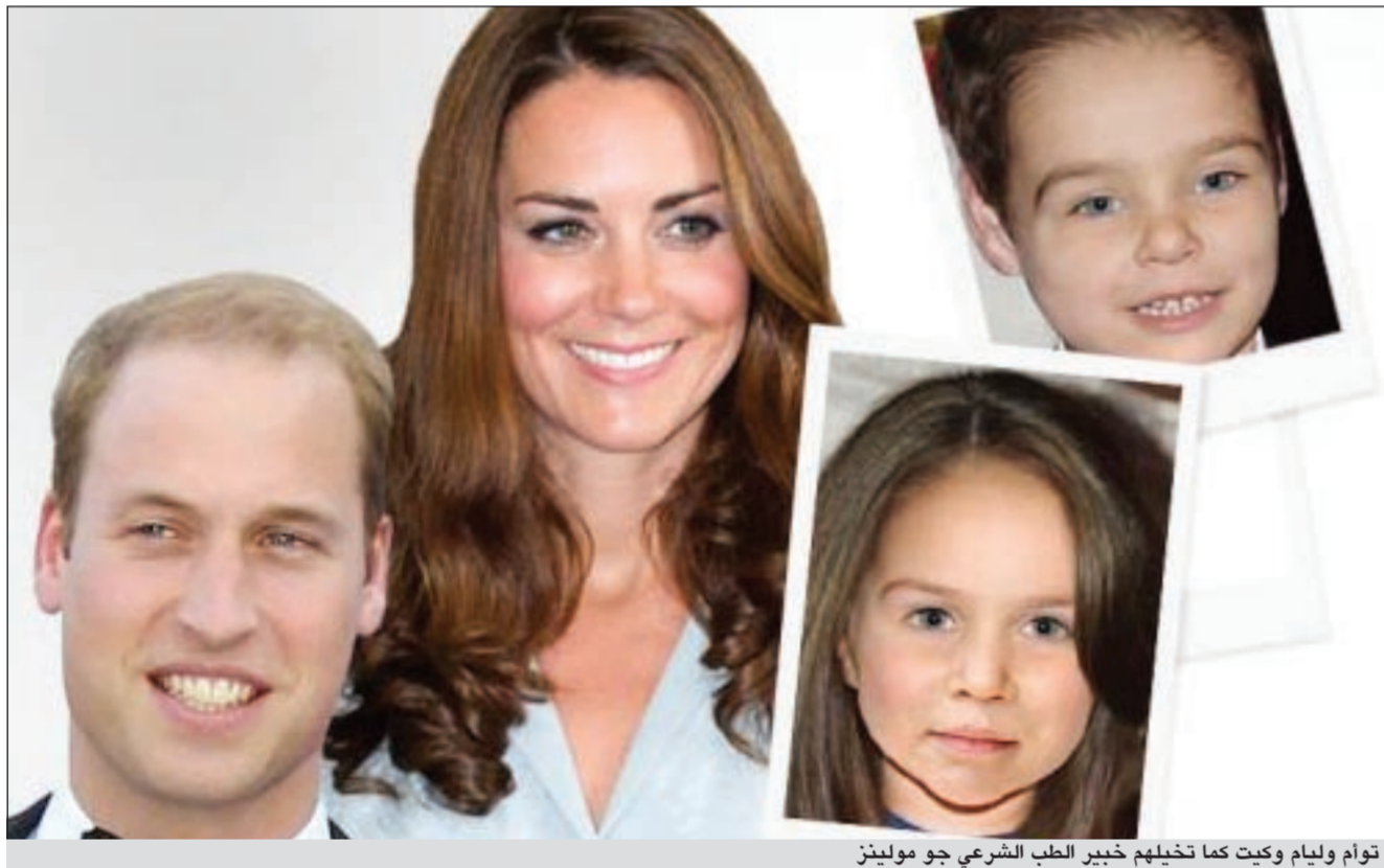
توأم وليام وكيت كما تخيلهم خبير الطب الشرعي جو مولينز

وكالات: توقع خبير في الطب الشرعي كيف يمكن أن يكون شكل الطفل الأول للأمير وليام وزوجته كيت دوقة كامبريدج. وأخذ جو مولينز أفضل الميزات من الزوجين وجمعها معاً، حيث أخذ العيون الزرقاء والبشرة النضرة وشعر كيت الكثيف ليكون بالنهاية طفلاً يحمل أوصاف الجمال الملكي.