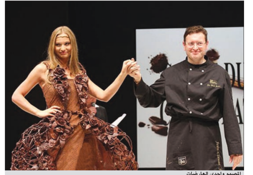
المصمم وأحدى العارضات

القاهرة - وكالات: ينتظر الملايين من عشاق الشوكولاتة والأزياء حول العالم، «صالون الشيكولاتة» الذي يعد الحدث الأضخم في باريس، حيث اتخذ مصمم الأزياء في فرنسا من الشيكولاتة كإداة وحيدة لتصميم الفساتين وتجنّب أنواع القماش المتعارف عليها، حتى اعتبرت عروض الأزياء بارتداء فساتين من الشيكولاتة تقليداً فرنسياً سنوي تتنظره ملايين النساء.