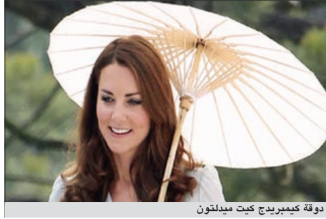
دوقة كيمبريدج كيت ميدلتون

وقت يشهد فيه قصر باكينغهام «حماً ملكياً»، لكن الظروف الحالية مختلفة، وهي السبب وراء القلق. فقد نقلت دوقة كيمبريدج إلى المستشفى في الثاني من الشهر الجاري، وهي تعاني نوعاً من غثيان الصباح المرتبط عموماً بمراحل الحمل الأولى، لكن إعلان الأطباء أن حالتها تصنف في خانة معينة تسمى hyperemesis gravidarum (أحد أشكال التقيؤ