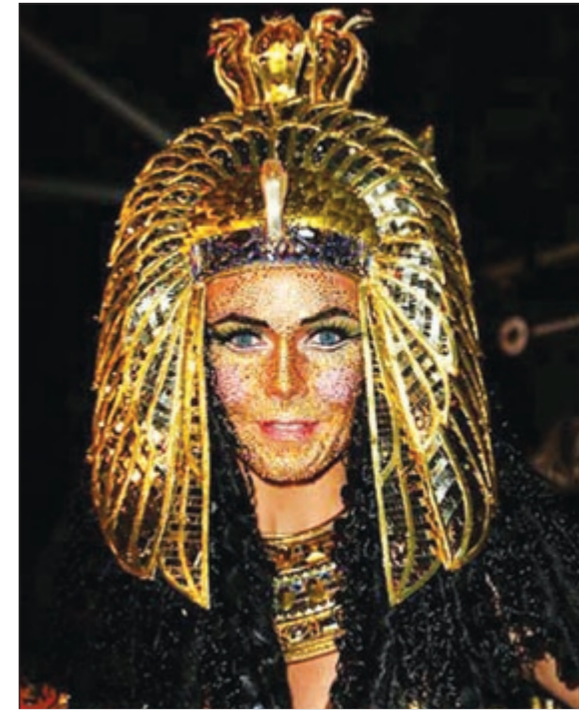
النجمة العالمية هايدي كلوم

بعد تأجيله لفترة طويلة بسبب اعصار ساندي احتفلت النجمة العالمية هايدي كلوم مؤخراً بالهلوان بشكل مميز في نيويورك، حيث ارتدت زي «كليوباترا» الذي أعدته منذ فترة لحضور حفل الهالوان هذا العام.