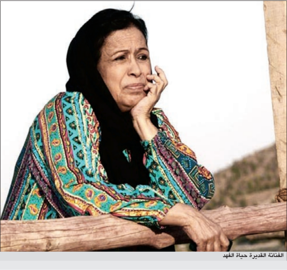
الفنانة القديرة حياة الفهد