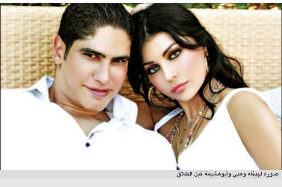
صورة لهيفاء وهبي وأبوهشيمة قبل الطلاق

وأكدت الفنانة اللبنانية، التي كان طلاقها مادة ندامة لوسائل الإعلام في الأسابيع الأخيرة، بأنها لا تؤمن بالصداقة بعد الطلاق، وقالت، بحسب موقع «جولوي» نقلا عن «وشوشة»: لا تؤمن بهذا الشيء وهذا نابع من تفكير امرأة بينما يتصرف الرجل بعقلانية أكبر في هذا الجانب ولكن بالتأكيد الاحترام موجود بيننا.. لن أقول المزيد أريد أن أحتفظ ببعض التفاصيل.