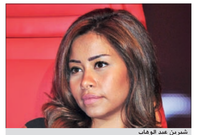
شيرين عبد الوهاب

أما المطربة شيرين عبد الوهاب، فغردت خارج السرب ولم تنشر أي شيء على حسابها الخاص على «تويتر»، بل اكتفت بإعادة نشر مقاطع فيديو خاصة بمواسب فريقها.