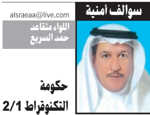
السلف أمينية اللواء متقاعد حمد السريع

وقالت المحامية الحبيب «نحن قدمنا طعنين انتخابيين وفي نفس الوقت نحن لا نشكك نهائياً في أي شخص من القضاء في أن يكون هناك خطأ متعمد، ولكن طعوننا تم تقديمها لأننا واثقون من أن الإنسان خطأ سواء كان قاضياً أو أي شخص آخر، ومن باب أن الخطأ لا يكون متعمد، إضافة إلى أن ما احتسبنا من أصوات أعلى من المعلنة».