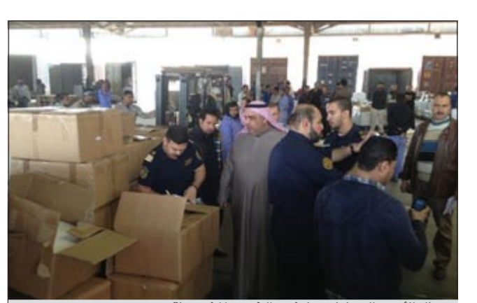
رجال الأمن والجمارك يعابنون الخمر المضبوطة

استطاع رجال جمارك ميناء الشويخ إحباط محاولة إدخال شاحنة مملدة بالخمر المستوردة كانت في طريقها إلى البلاد من إحدى الدول خليجية وعليه