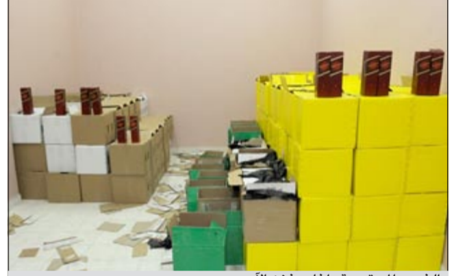
الخمر المستوردة داخل مخزن أسويي

واصل رجال الإدارة العامة لمكافحة المخدرات جهودهم الحثيثة لتعقب تجار المواد المخدرة، والمسكرات والمؤثرات العقلية،