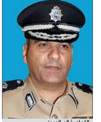
اللواء خالد الدين

أكد مدير عام الإدارة العامة للمؤسسات الإصلاحية اللواء خالد الدين جاهزية الإدارة لإقامة معرض أسبوع التزليل الخليلجي الموحد وأشار اللواء خالد الدين إلى أن الإجماع الخليلجي شدد على تحقيق وتطبيق وتنفيذ ذلك الأسبوع وما يحمله من فعاليات مختلفة ليؤكد أهمية مؤسسات المجتمع المدني، ودورها في العملية الإصلاحية والتأهيلية، والعمل على إشراكها وتقريب للمسافات مع نزلاء المؤسسات الإصلاحية والعقابية، وفتح