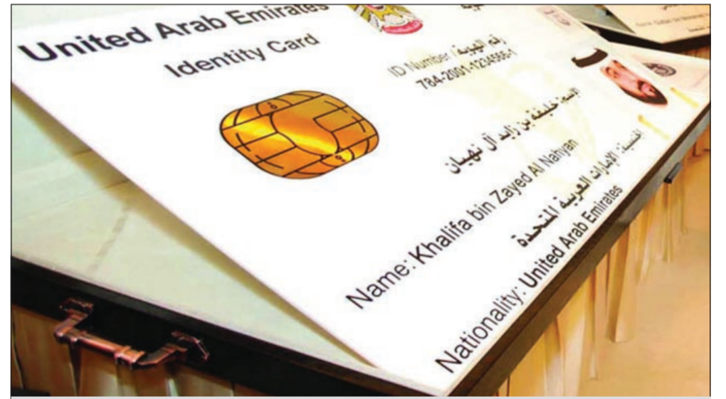
البطاقة التي دخلت «غينيس»