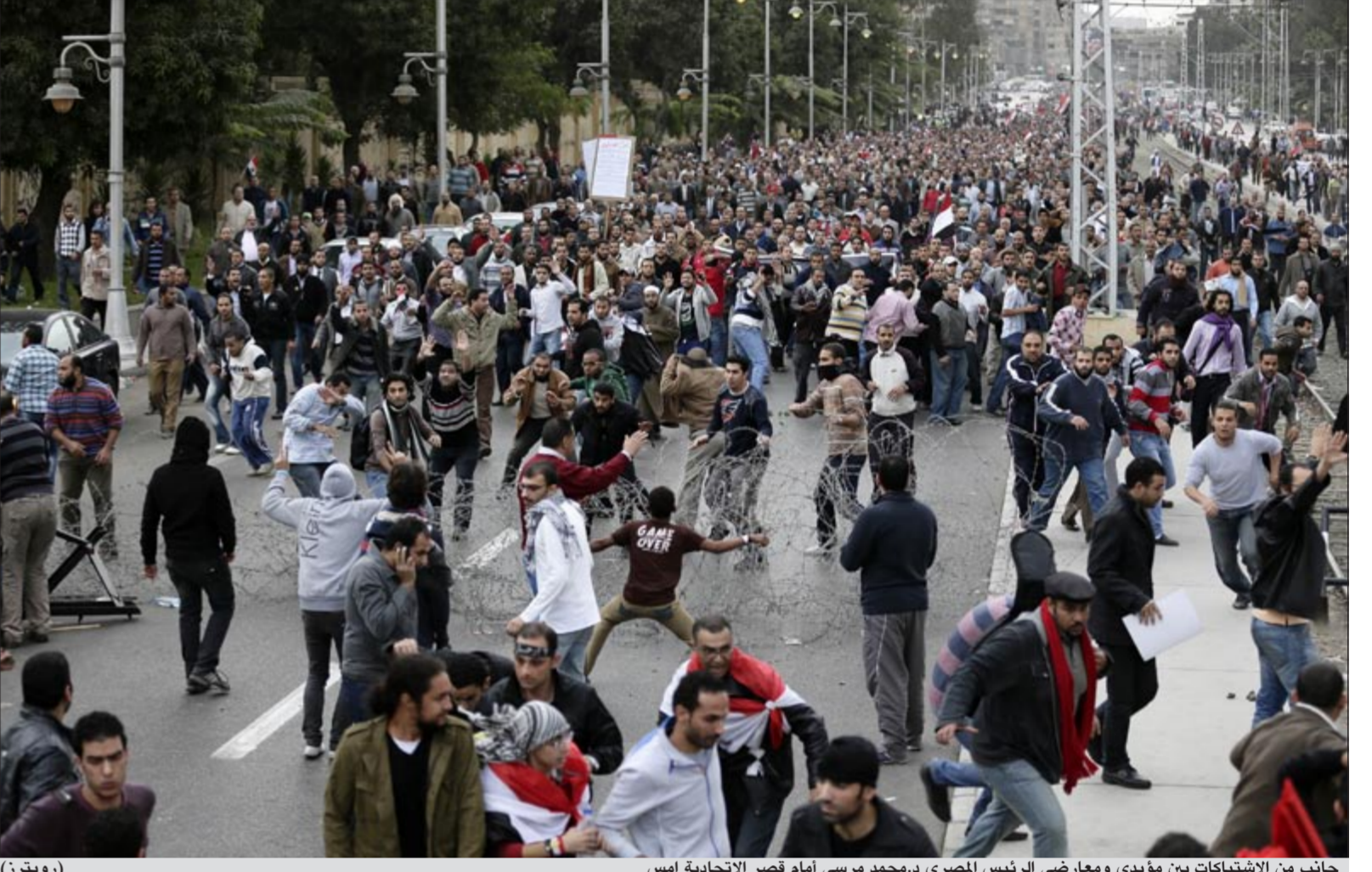
جانب من الاشتباكات بين مؤيدي ومعارضى الرئيس المصري د.محمد مرسي أمام قصر الاتحادية أمس

عواصم - وكالات: على مدى الأيام الماضية نجح المقر الدائم لرئاسة الجمهورية (قصر الاتحادية) في استقطاب الأضواء من ميدان التحرير، والاستحواد على مساحات إعلامية كبيرة في كافة القنوات الفضائية، حيث شهدت «الاتحادية»، أمس وأمس الأول مظاهرات معارضة ومؤيدة للرئيس محمد مرسي. ونزل أنصار الرئيس مرسي ومعارضوه إلى الشارع بعد ظهر أمس أمام قصر الرئاسة في القاهرة حيث تحول المكان إلى ساحة للعراك بين الجمهوريين، ما أدى إلى سقوط عدد من الجرحى غداة تظاهرة حاشدة غير مسبوقة في المكان نفسه منذ ثورة 2011.