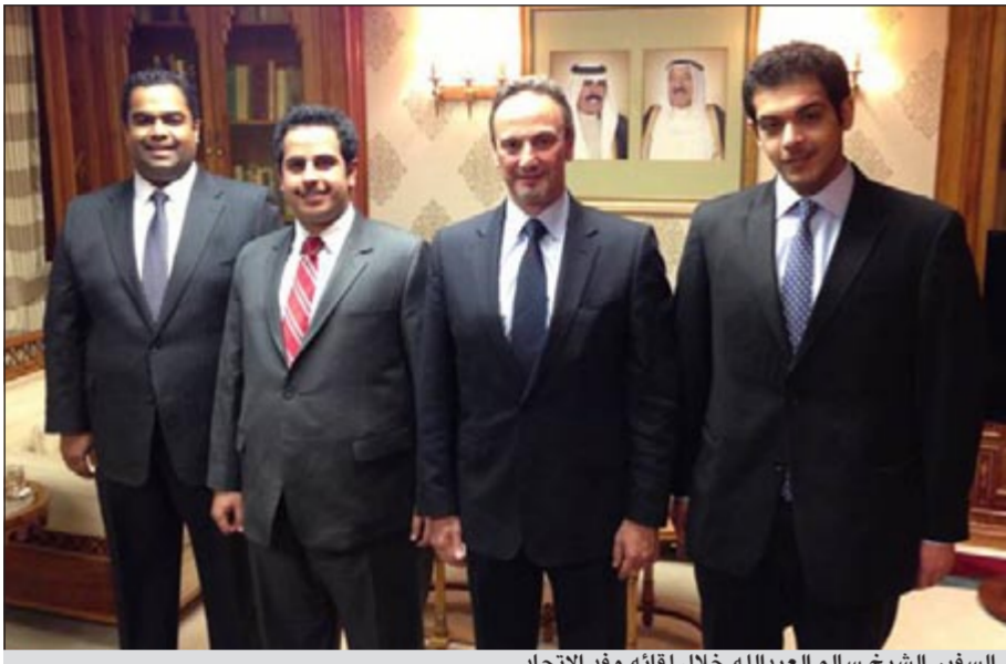
السفير الشيخ سالم عبدالله خلال لقائه وفد الاتحاد

50 جامعة في الولايات المتحدة الأمريكية، وبحث أعضاء الاتحاد أيضا موضوع تحسين أداء الملاحق الثقافية وزيادة المرشدين الأكاديميين بعد الزيادة الكبيرة في أعداد الطلبة، وطرح أعضاء الاتحاد في لقاءهم مع السفير مطلب تسهيل شروط الالتحاق بالبعثات للطلبة الدارسين على حسابهم الخاص.