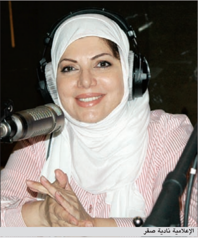
الإعلامية نادية صقر