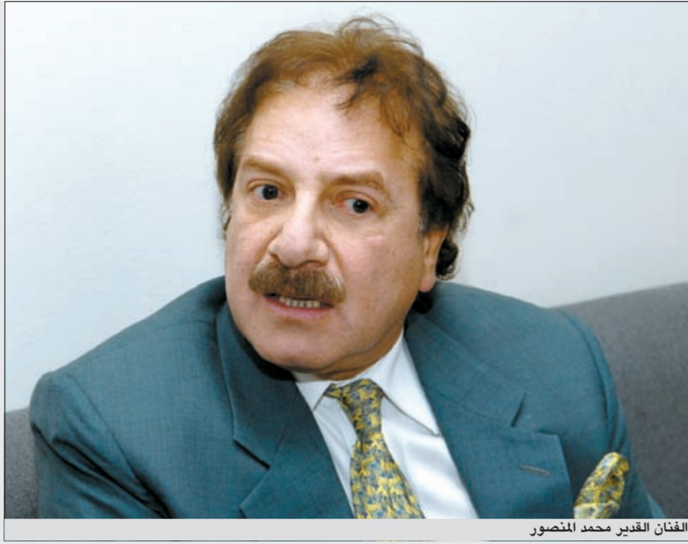
الفنان القدير محمد المنصور