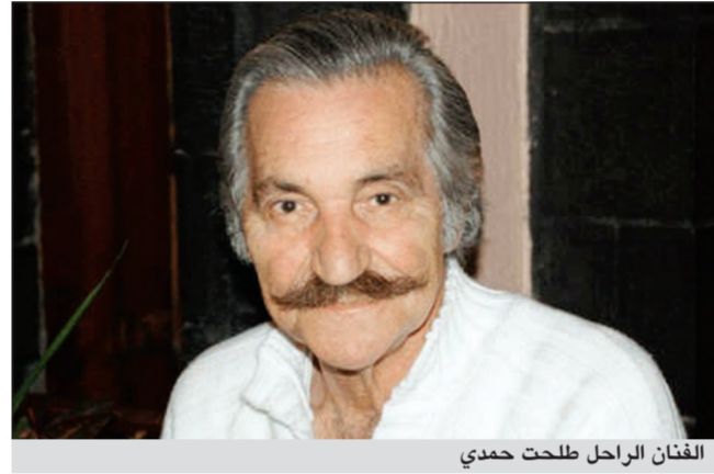
الفنان الراحل طلحت حمدي