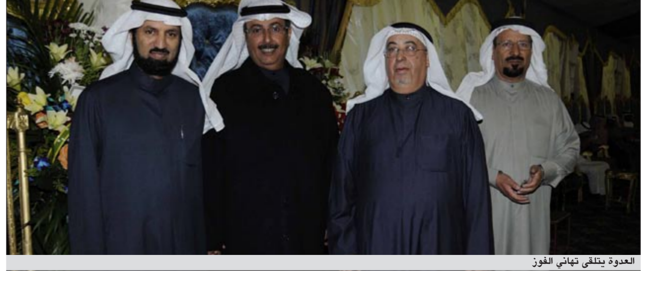
العدة يتلقى تهاني الفوز