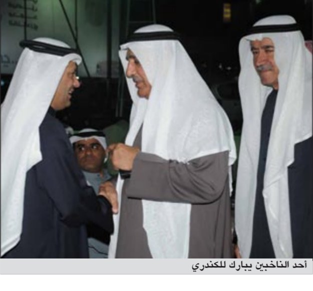
أحد الناخبين ببارك للكندري