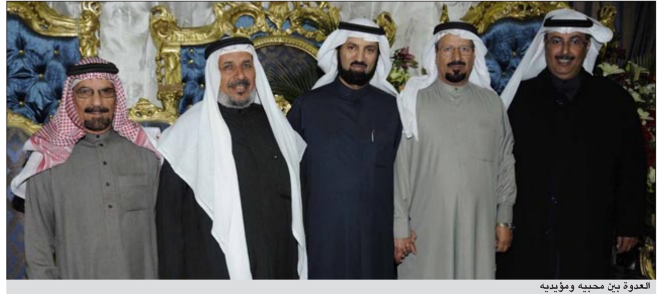
العدة بين محبيه ومؤيديه