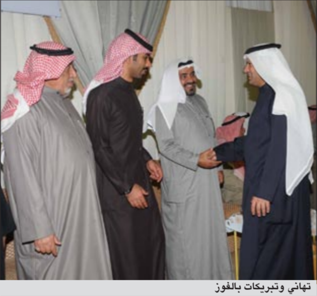
تهاني وتبريكات بالفوز