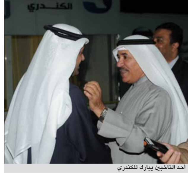
أحد الناخبين ببارك للكندري