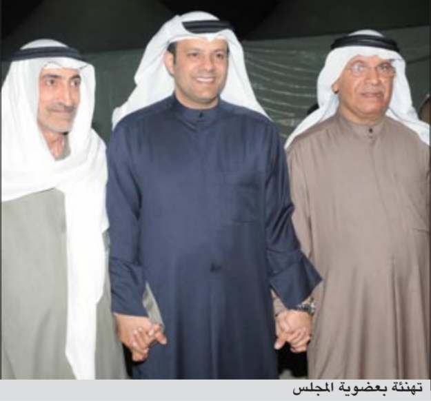
تهنئة بعضوية المجلس