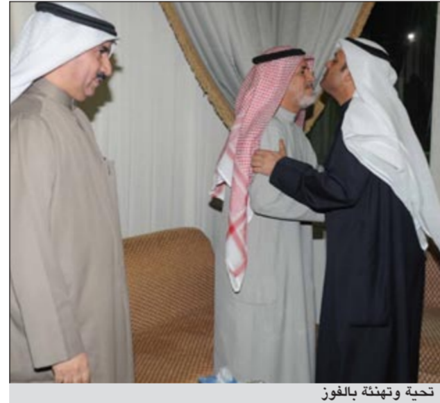
تحية وتهنئة بالفوز