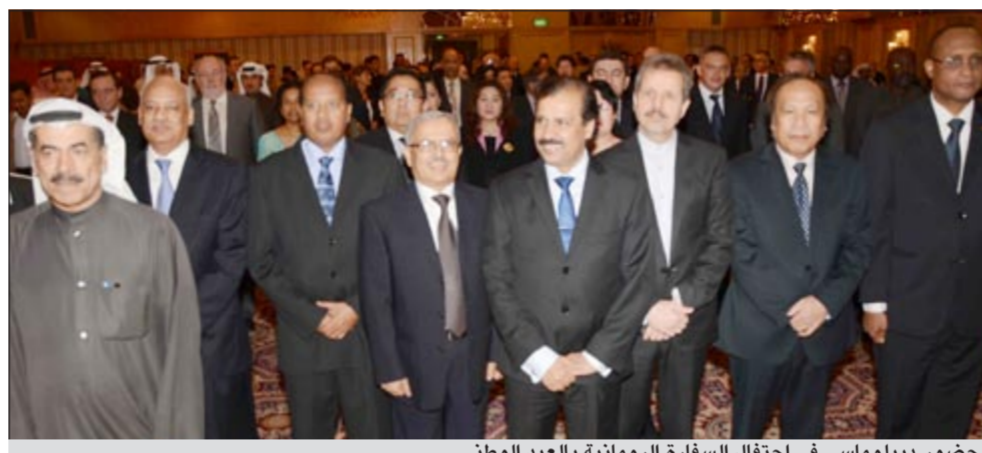
حضور ديبولماسي في احتفال السفارة الرومانية بالعيد الوطني