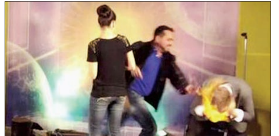
لقطة فيديو توضح لحظة احتراق وجه الساحر

العربية. نست: تعرض الساحر الاميركي واين هوتشن لحادث خطير أثناء اشتراكه في برنامج تلفزيوني في الدومينيكان، ففي حين كان الساحر يتبادل اطراف الحديث مع فريق الاعداد في السويدو، قام مخرج البرنامج بشكل مفاجئ وغير متوقع برمي ماء الفلورايد شديد الاشتعال على رأس هوتشن الذي راح يركض محاولا لطفاءه وطلبا المساعدة، وبعد ان تم تداول الفيديو على موقع يوتيوب علق الساحر على صفحته على الفيسبوك قائلا انه تعرض لهجوم جنائي بحسب وصفه.