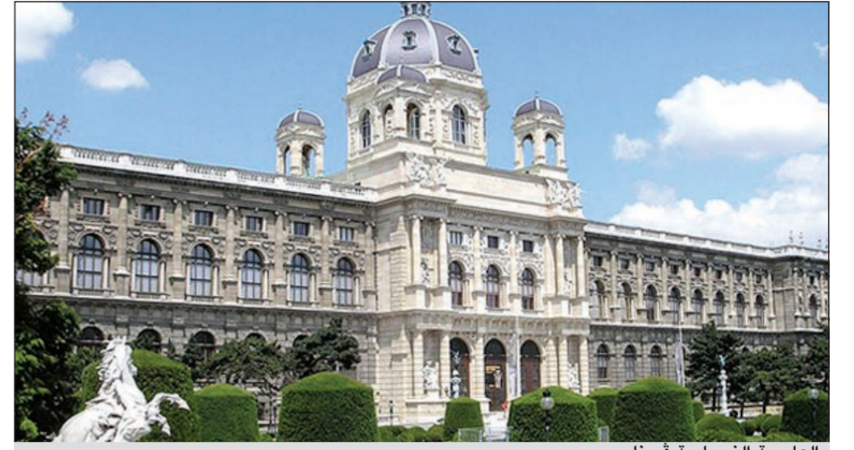
العاصمة التمسوية فينا

فينا - رويترز: أظهر أحدث مسح عالمي أجرته مجموعة ميريس للاستشارات أن العاصمة التمسوية فينا ما زالت أفضل مدينة يمكن العيش بها في العالم، بينما حلت العاصمة العراقية بغداد في المركز الأخير. تصدرت فينا التي يبلغ عدد سكانها 1,7 مليون نسمة المسح للعام الرابع على التوالي بفضل ما بها من حياة ثقافية غنية ورعاية صحية شاملة وتكاليف سكن معقولة إلى جانب هندستها المعمارية التي تعود إلى زمن امبراطورية هابسبورج. ولا يكلف نظام النقل العام في فينا سوى يورو واحد (1,30 دولار) يوميا مع استخدام بطاقة يجري إصدارها سنويا للتنقل في المدينة التي يحكمها الحزب الديموقراطي الاجتماعي وحزب الخضر.