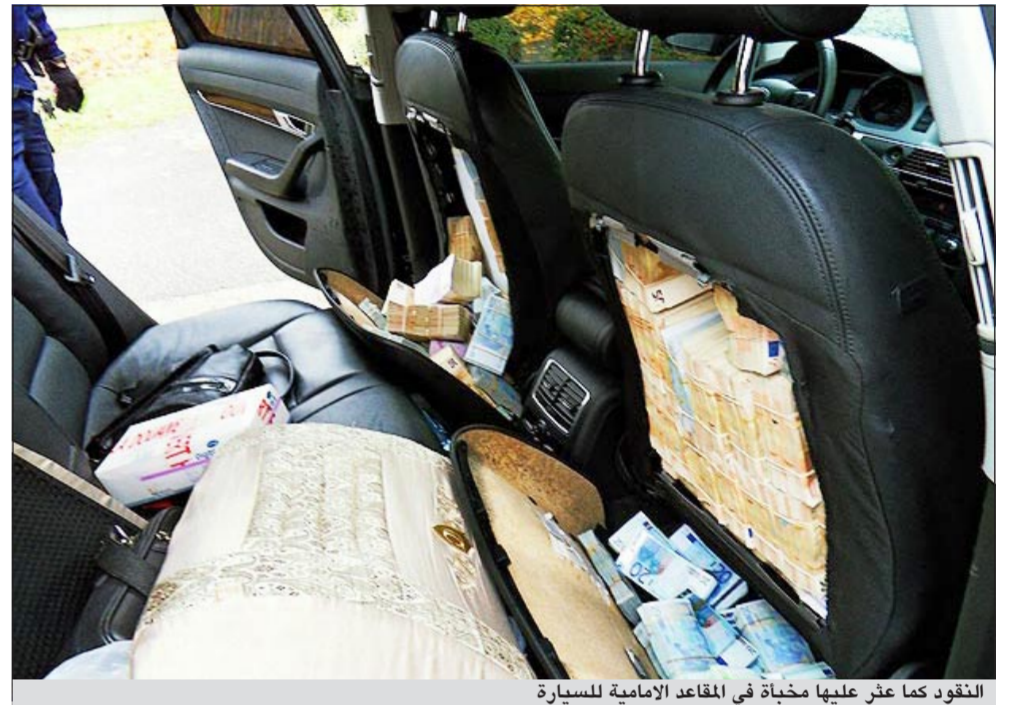
التقود كما عثر عليها مخبأة في المقاعد الامامية للسيارة

ستراسبورغ - د.ب.أ: ألقت سلطات الجمارك في إقليم الازراس شرقي فرنسا على رجلين كانا يخفيان 1.8 مليون يورو داخل فرش مقاعد السيارة التي كانا يقودانها على أحد الطرق السريعة متجهين إلى النمسا. وقال مارك شتاينر رئيس المكتب المحلي للجمارك في ستراسبورغ أول من أمس إن الرجلين كانا يخفيان داخل فرش مقاعد السيارة ما يزيد على 38 ألف ورقة نقود. ويجري التحقيق مع الرجلين