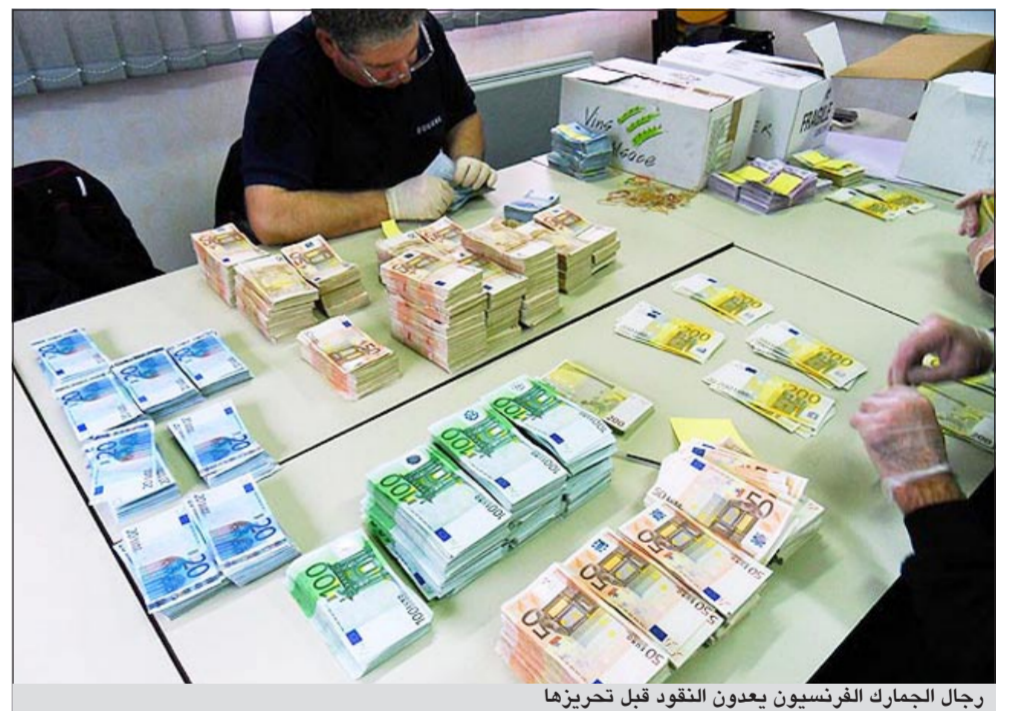
رجال الجمرك الفرنسيون يعدون النقود قبل تحريرها

ستراسبورغ - د.ب.أ: ألقت سلطات الجمارك في إقليم الازراس شرقي فرنسا على رجلين كانا يخفيان 1.8 مليون يورو داخل فرش مقاعد السيارة التي كانا يقودانها على أحد الطرق السريعة متجهين إلى النمسا. وقال مارك شتاينر رئيس المكتب المحلي للجمارك في ستراسبورغ أول من أمس إن الرجلين كانا يخفيان داخل فرش مقاعد السيارة ما يزيد على 38 ألف ورقة نقود. ويجري التحقيق مع الرجلين