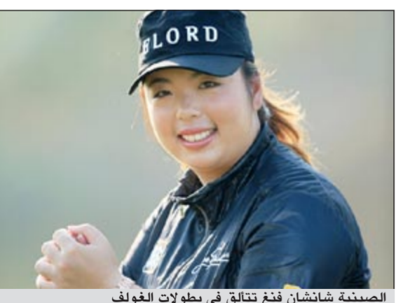
الصينية شانشان فتحت تتالق في بطولات الغولف

تفخر علامة أوميجا بالإعلان عن انضمام بطلة لعبة الغولف الصينية شانشان فنغ إلى عائلة سفراء العلامة الرائدة وبالتالي تصبح جزءاً من قائمة تضم غريغ نورمان وسيرجيو غارسيا وميشيل وي. وستظهر لاعبة الغولف الشابّة لأول مرة كسفيرة لعلامة أوميجا اليوم في بطولة أوميجا دبي ماسترز للسيدات. وتعتبر شانشان فنغ إحدى لاعبات الغولف الأكثر براعة في العالم، وأصبحت لاعبة الصينية الأولى المشاركة في بطولة PGA Tour ومنذ ذلك الحين وخلال السنوات عرفت باعتبارها أحد أقوى المتنافسين في هذه البطولة. وفي عام 2012 فازت البطلة الشابّة ذات الثلاثة وعشرين ربيعاً في بطولة LPGA وأصبحت لاعبة الغولف الصينية الأولى التي تفوز بجائزة كبرى.