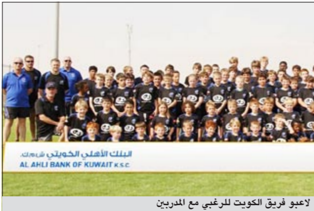
لاعبو فريق الكويت للرغبي مع المدربين

زيادة عدد المنتسبين واللاعبين في الفريق. وأضاف: «إن رعايتنا تأتي من إيمان البنك بضرورة المساهمة والمشاركة بنشاطات المجتمع واهتمامات الشباب ودعمهم حتى يصلوا إلى مراحل متقدمة تمكنهم من المنافسة عالمياً». وقال مدير عام إدارة الخدمات المصرفية للأفراد ستوراوت لوكي: «نحن سعداء في البنك الأهلي الكويتي برعايتنا لفريق الكويت للعبة الرغبي للسنة الثالثة على التوالي، حيث لسنا اهتمام المجتمع بهذه الرياضة