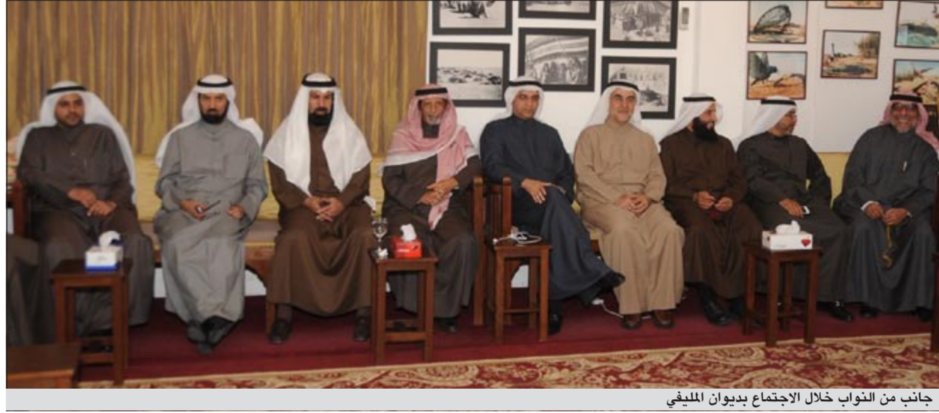
جانبا من النواب خلال الاجتماع بديوان المليفي