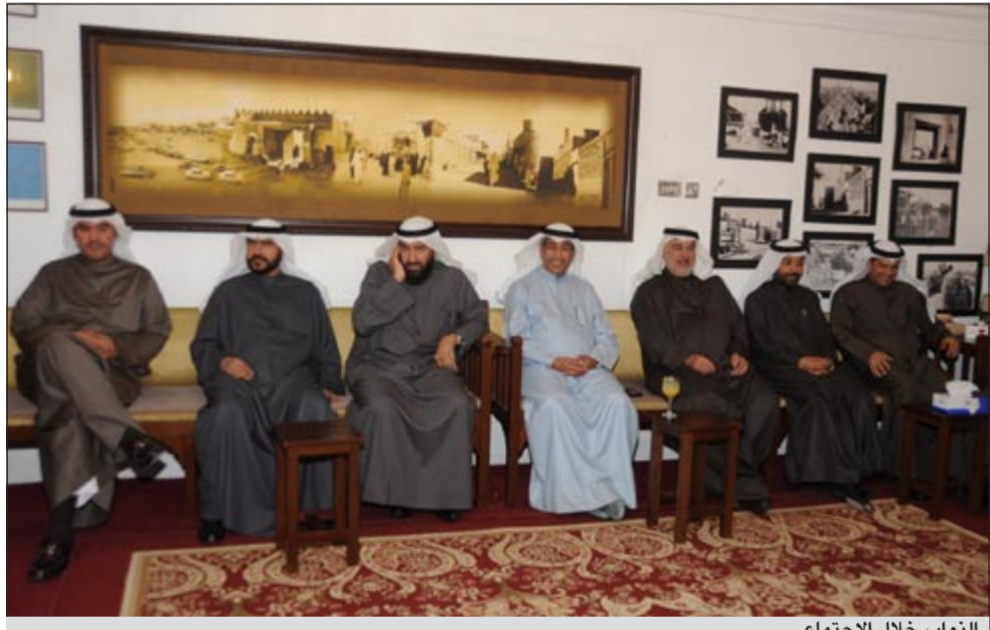
النواب خلال الاجتماع