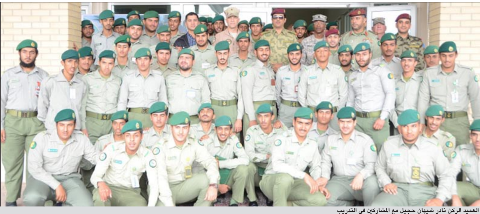
العميد الركن نادر شهبان حجيل مع المشاركين في التدريب