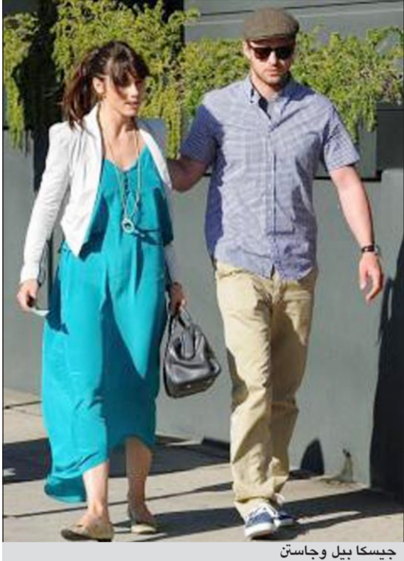
جيسكا بيل وجاستن

وصفت الفنانة الأميركية الشابة جيسكا بيل، حياتها مع زوجها النجم جاستن تمبرليك بالمنهولة. وأكدت بيل أنها حتى الآن لم تستوعب فكرة الزواج حيث انه لم يتغير أي شيء ظاهر في حياتها، الا انها تؤكد ان هناك شيئاً غير ملموس في حياتها قد تغير. وأشارت الى انها حتى الآن لا تستسيغ قول كلمة «زوجي» على لسانها وتشعر انها كلمة غريبة، الا انها اوضحت في الوقت نفسه ان تمبرلك مهمل وحياتها معه رائعة للغاية، فهو يشعر انه بجوارك دوماً ويتحمل معك كل شيء، وأضافت ضاحكة: «كما انه سيغفر المصايح التالفة، ويقوم بغسل الأطباق المتسخة».