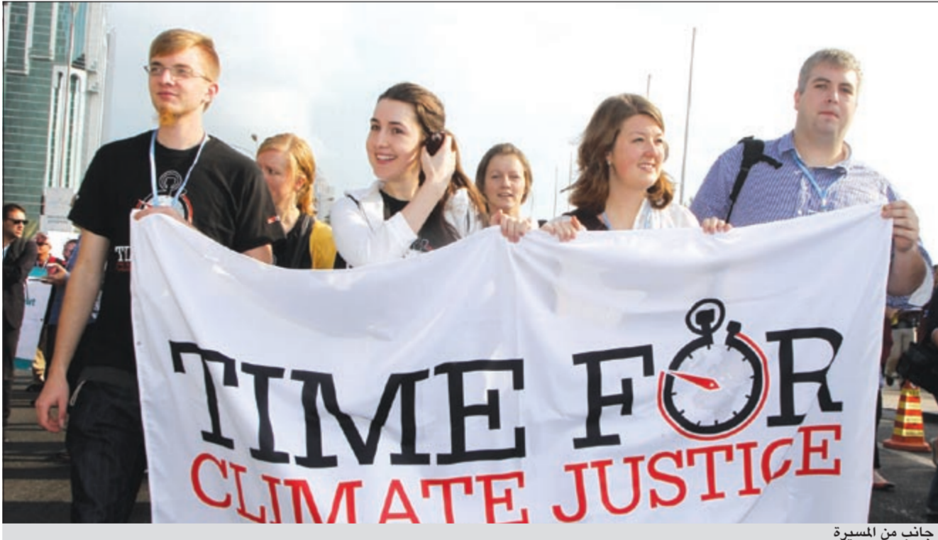
جانب من المسيرة