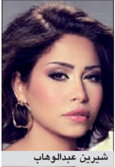
شيرين عبد الوهاب

وعن أسباب اقدامها على هذه التجربة قالت أنها تفكر منذ فترة في دخول عالم الدراما والفوازير لكن لم تكن تستنج لها الفرصة من قبل للاقدام على هذه الخطوة.