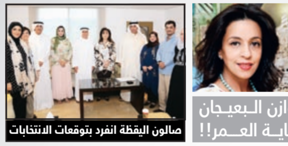
هوازن البيجان وكهاية العمر!!