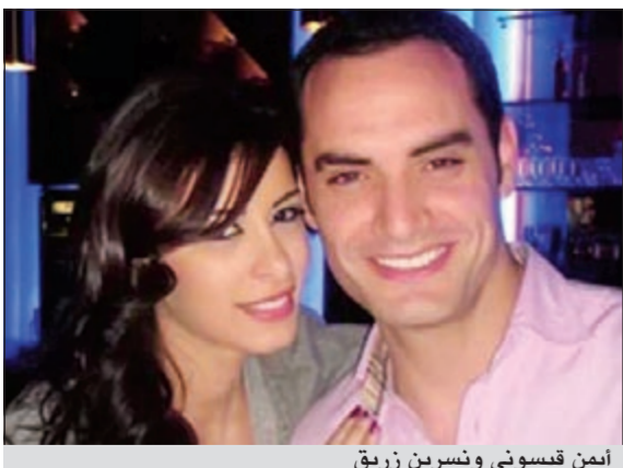
أيمن قيسوني ونسرين زريق

بعد قصة حب استمرت ثلاث سنوات، أعلن الفنان أيمن قيسوني عبر حسابه الخاص على موقع التواصل الاجتماعي «فيسبوك» عن زواجه من الفنانة نسرين زريق ولم يعلن أيمن عن مكان الزواج وهل كان في القاهرة أو بيروت.