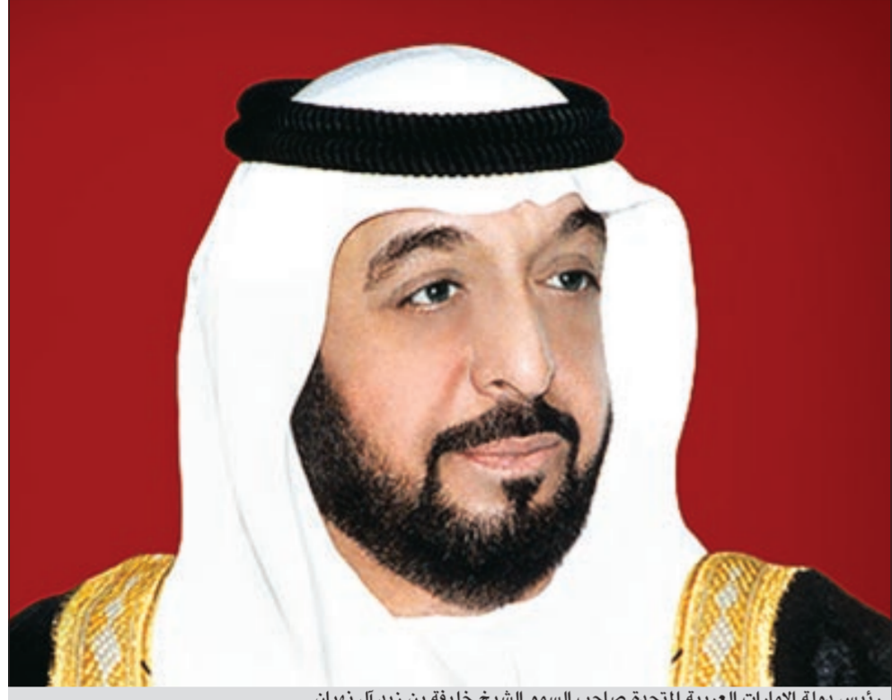
رئيس دولة الإمارات العربية المتحدة صاحب السمو الشيخ خليفة بن زايد آل نهيان