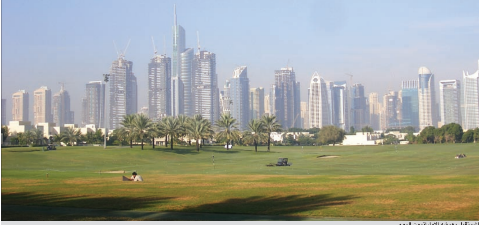
المستقبل يعيشه الإماراتيون اليوم