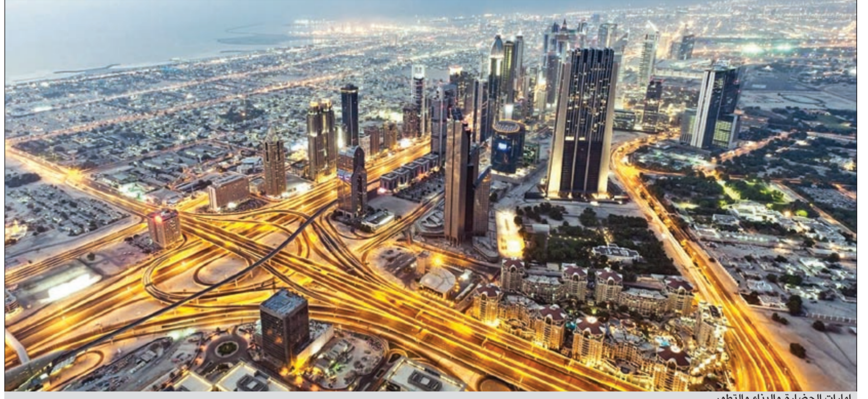
إمارات الحضارة والبناء والتطور