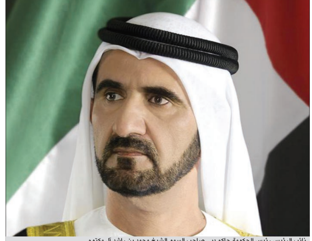
نائب الرئيس رئيس الحكومة حاكم دبي صاحب السمو الشيخ محمد بن راشد آل مكتوم