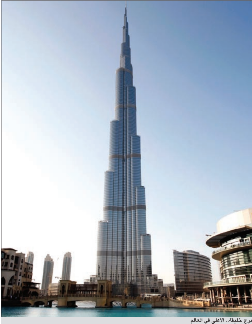
برج خليفة.. الأعلى في العالم

وتستضيف دولة الإمارات على أراضيها الملايين من العاملين من نحو 200 جنسية من مختلف قارات العالم، يتمتعون مع عائلاتهم بمستوى جيد من الإقامة والعيشة وبالأمن والاستقرار، ويتمتعون بحقوقهم كاملة التي تنظمها قوانين صارمة لعلاقات العمل، إضافة إلى حريتهم في ممارسة معتقداتهم وشعائرهم الدينية بحرية وأمان. كما تكفل القوانين حقوقهم في