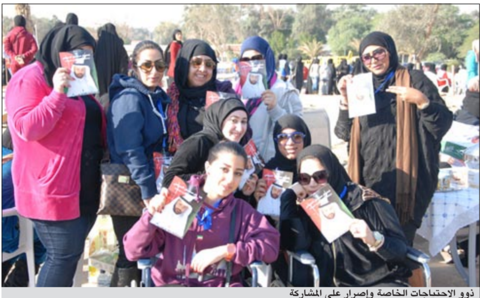
ذوو الاحتياجات الخاصة وإصرار على المشاركة