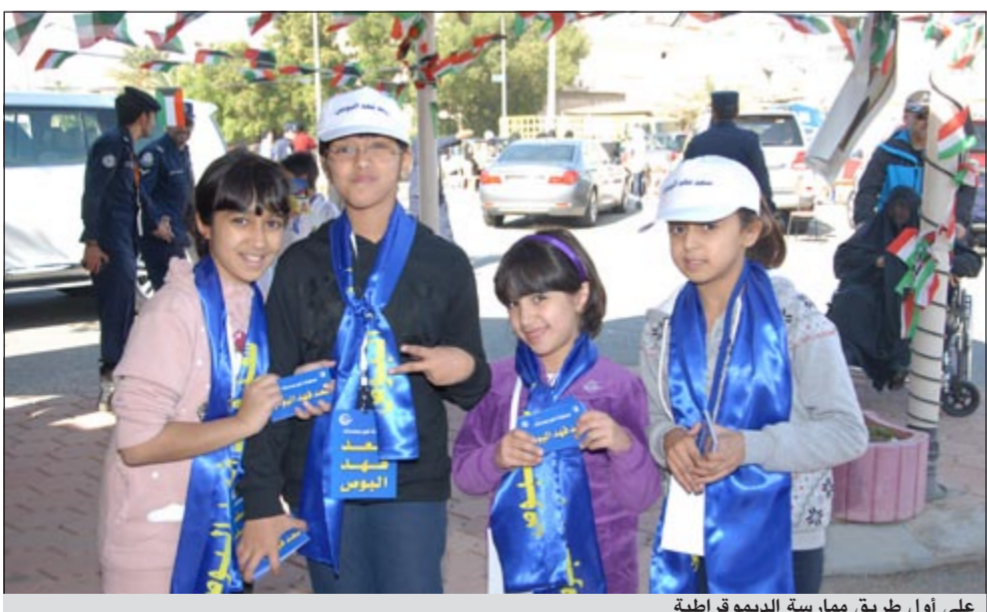
على أول طريق ممارسة الديمقراطية