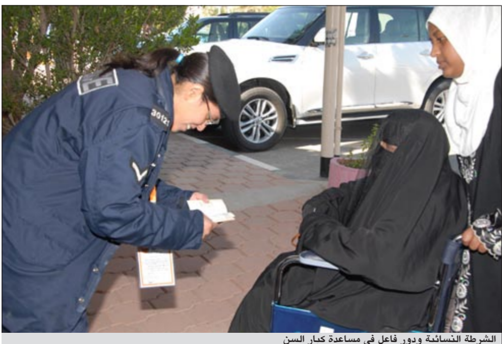
الشرطة النسائية ودور فاعل في مساعدة كبار السن