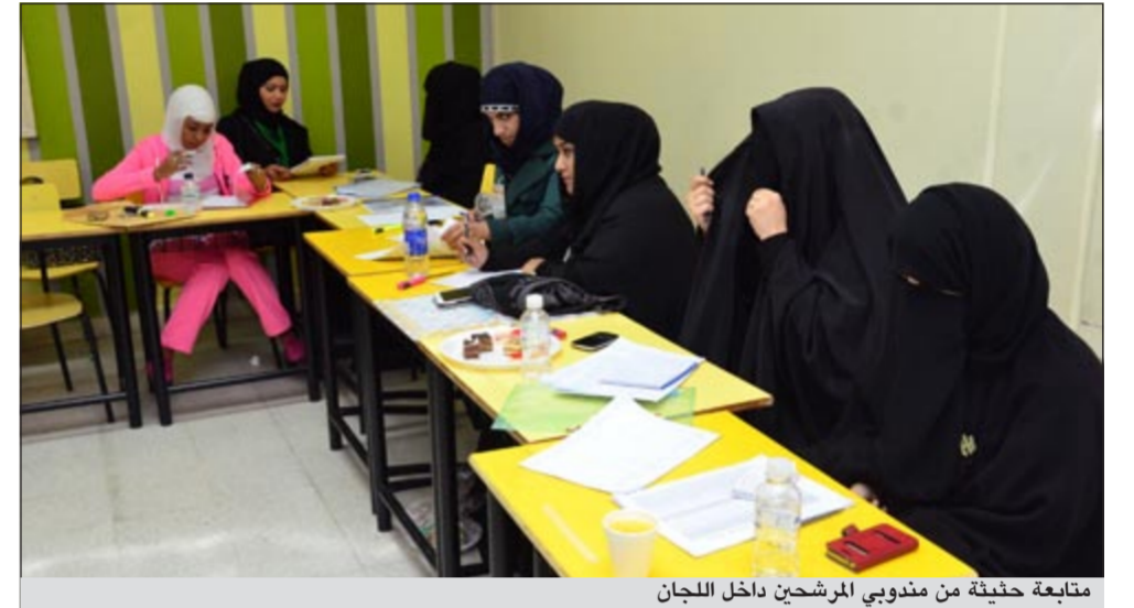
متابعة حثيئة من مندوبي المرشحين داخل اللجان

تسابق مندوبي ومندوبات المرشحين على تقديم المساعدة للناخبين في معرفة أرقام قيودهم الانتخابية وخصوصا كبار السن الذين كان لهم الحضور الأكبر.