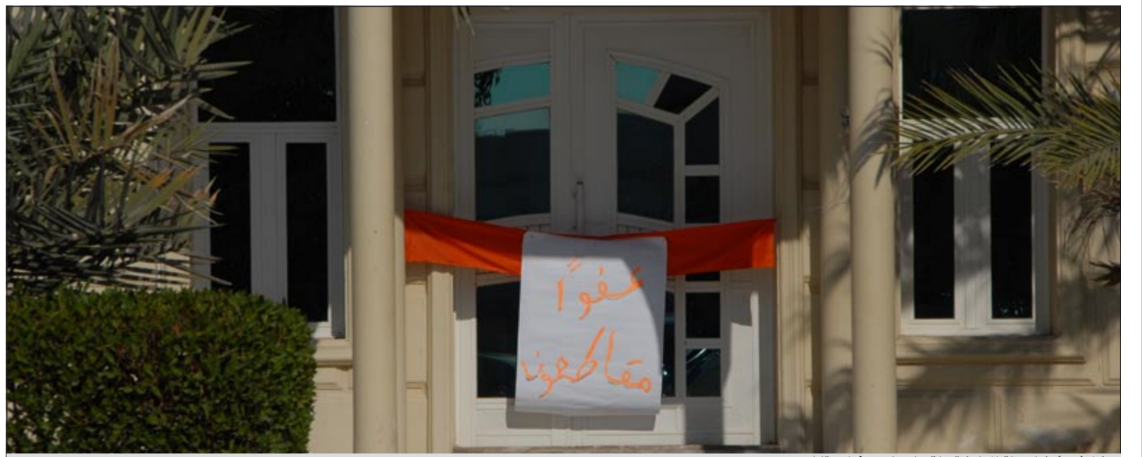
منزل أحد أعضاء كتلة المعارضة علق على بابه «عفواً.. مقاطعون»

تقيق الحكومة من غيبوبتها بعد درس اليوم «أمس». وعند إغلاق صناديق الاقتراع في تمام الساعة الثامنة من مساء أمس، عقدت المعارضة اجتماعا موسعا لها بديوان رئيس مجلس الأمة الأسبق أحمد السعدون حيث تداولت في الأوضاع السياسية الحالية واستطلعت قراءتها حول نسبة المشاركة في الانتخابات الحالية.