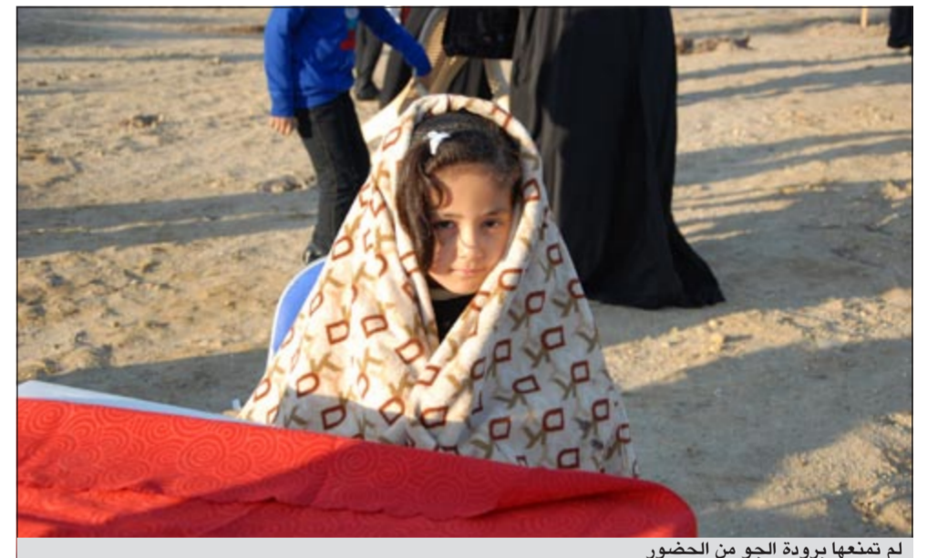
لم تمنعها بروة الجو من الحضور