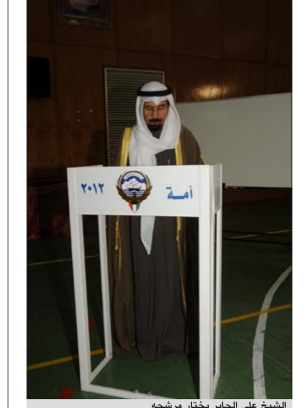
الشيخ علي الجابر يختار مرشحه

الجابر: نتوقع أن يستفيد النواب الجدد من تجارب المجالس السابقة