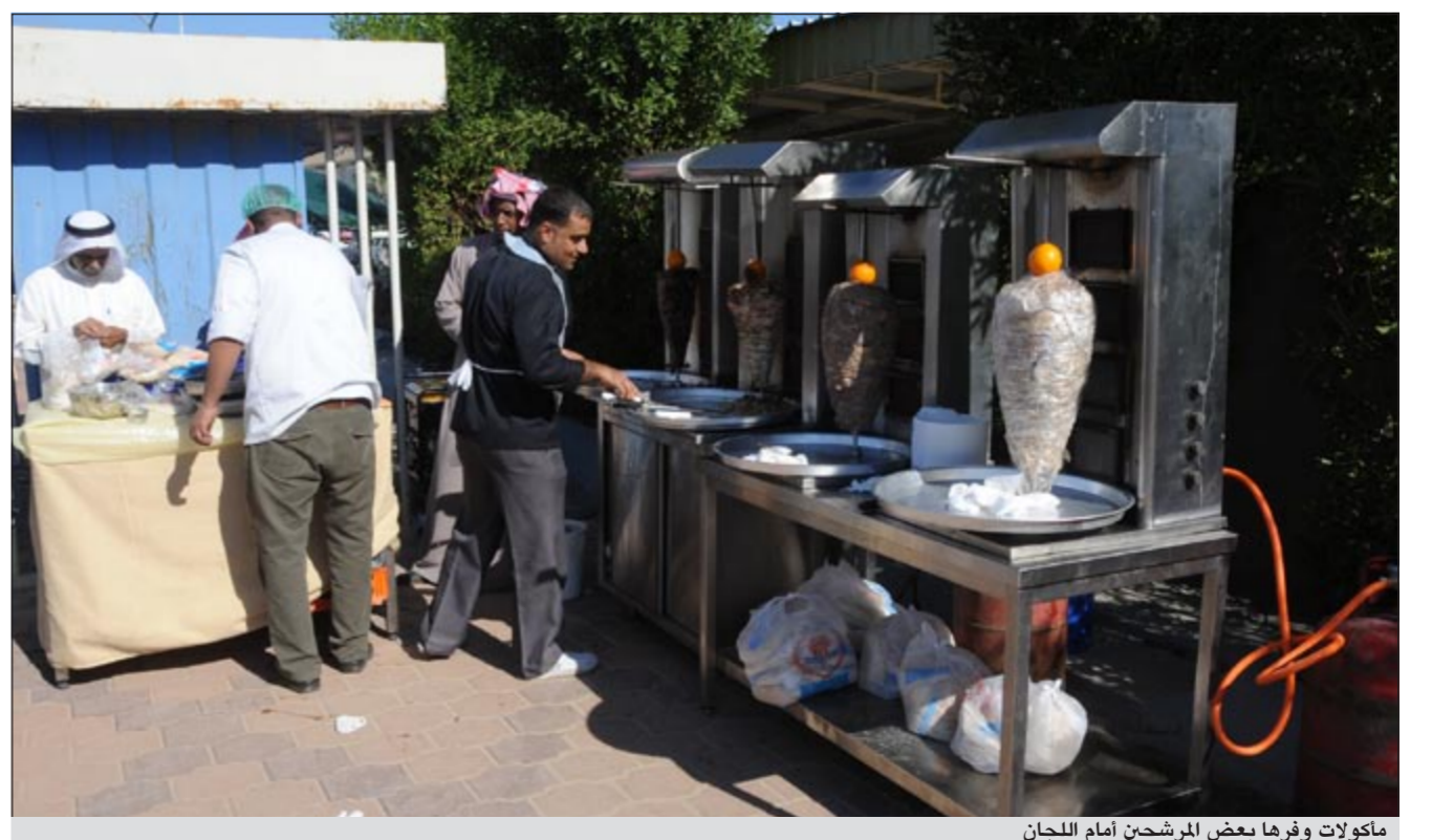
ماكولات وقرها بعض المرشحين أمام اللجان