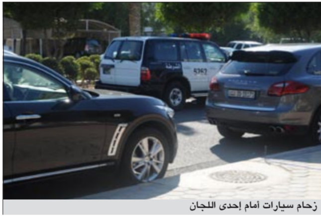
زحام سيارات أمام إحدى اللجان