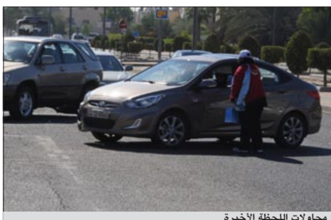
محاولات اللحظة الأخيرة