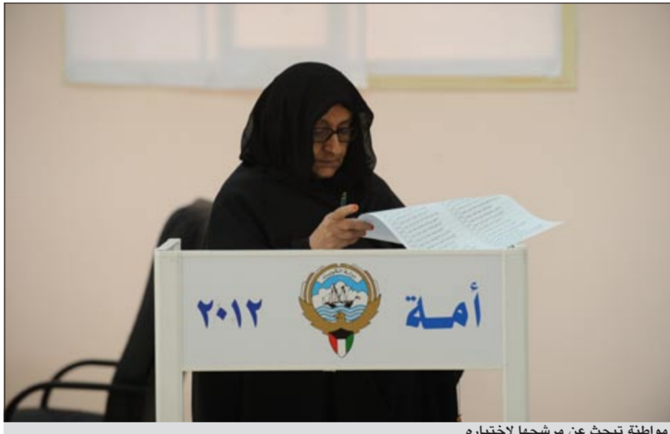
مواطنة تبحث عن مرشحها لاختياره

فريق العمل: مسعد حسني - رشيد الفهم - أمير زكي - حنان عبدالمعبود - رندى مرعي - لميس بلال - محمد راتب - ناصر الوقيت - بدر السهيل - أحمد عفيفي