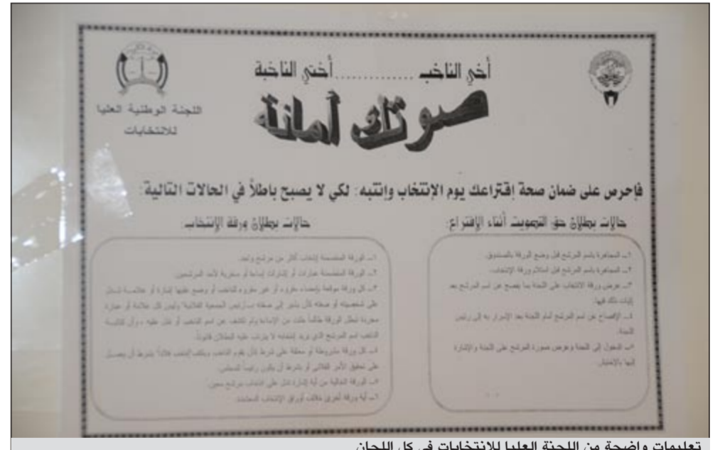
تعليمات واضحة من اللجنة العليا للانتخابات في كل اللجان