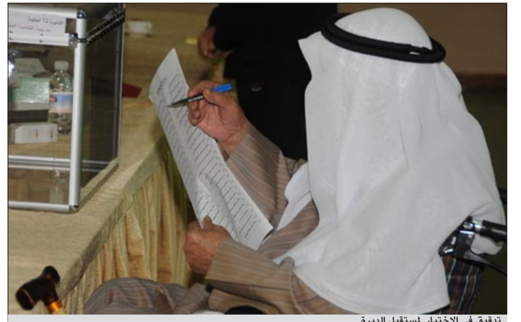
تدقيق في الإختيار لمستقبل الديرة