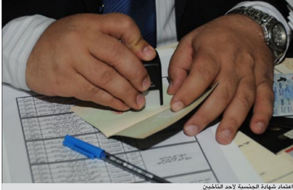
اعتماد شهادة الجنسية لأحد الناخبين