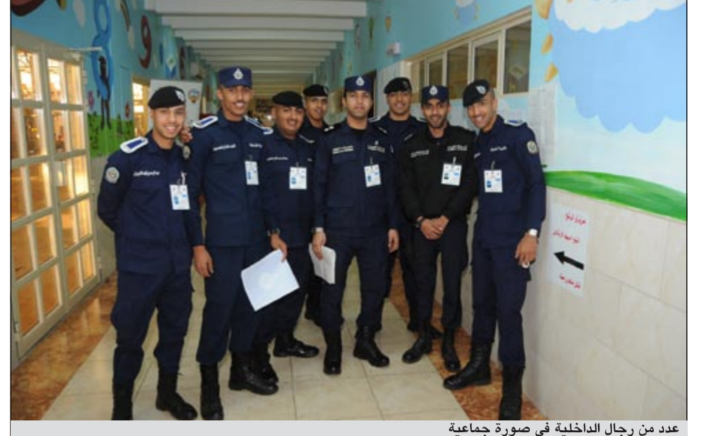
عدد من رجال الداخلية في صورة جماعية