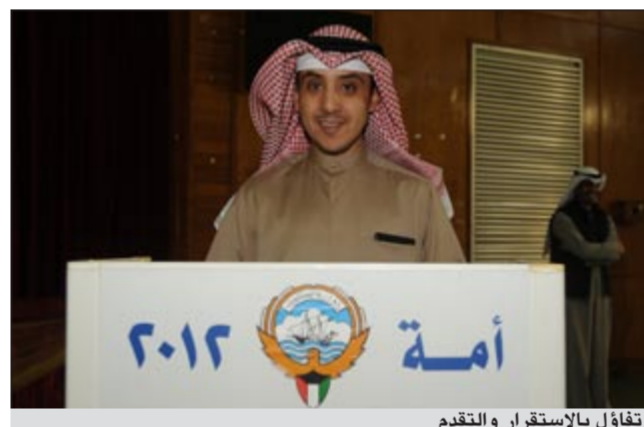
تقاؤل بالاستقرار والتقدم