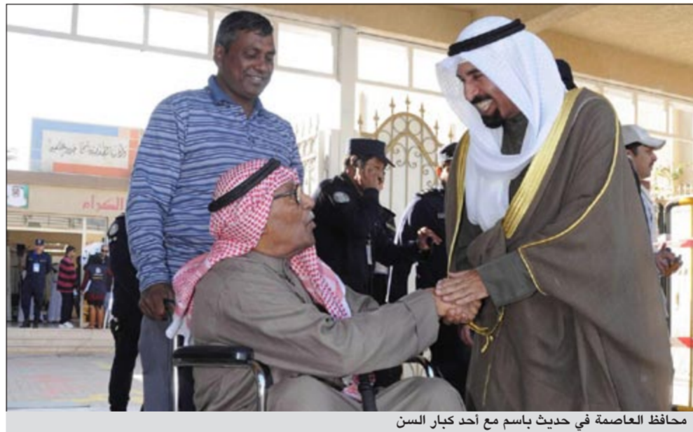
محافظ العاصمة في حديث باسم مع أحد كبار السن