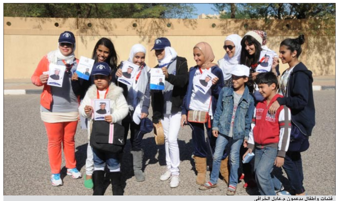
فتيات وأطفال يدعمون م.عادل الخرافي