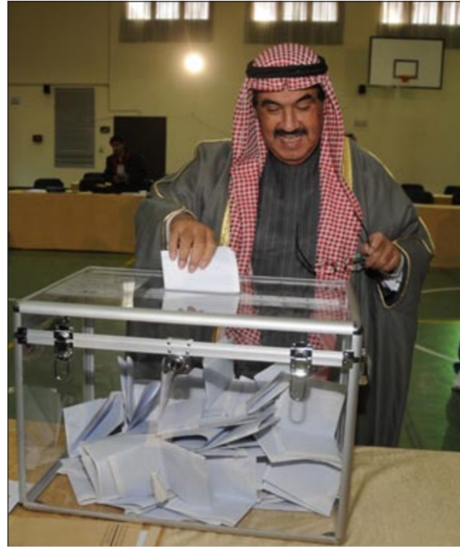
سمو الشيخ ناصر المحمد مدليا بصوته