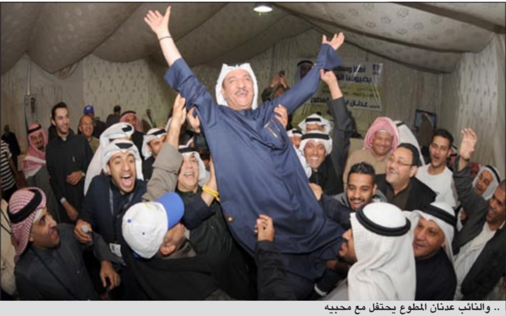
.. والنائب عدنان المطوع يحتفل مع محبيه