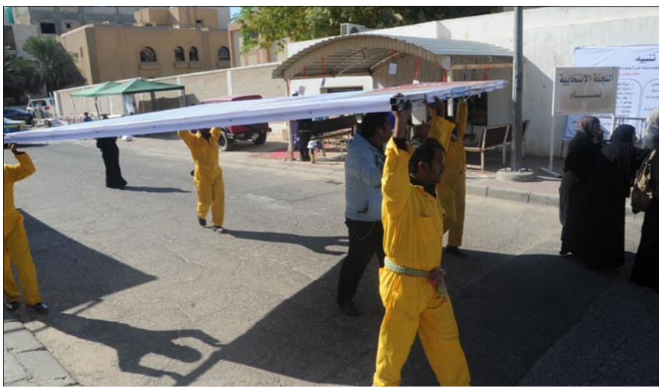
إزالة بعض الإعلانات المخالفة من أمام إحدى اللجان