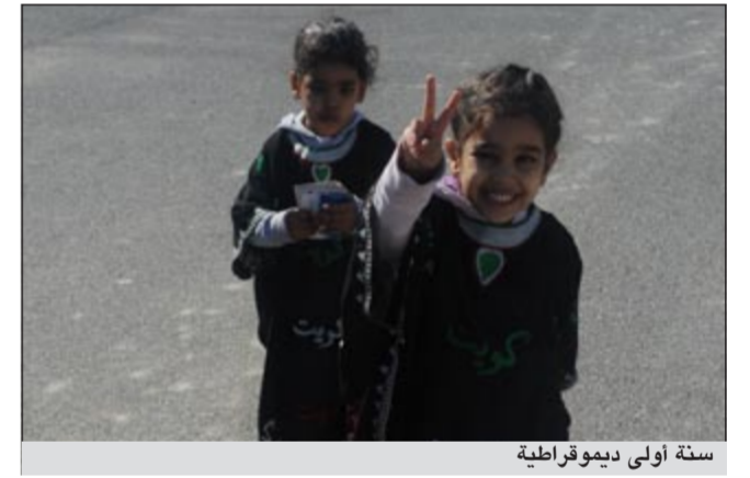
سنة أولى ديموقراطية