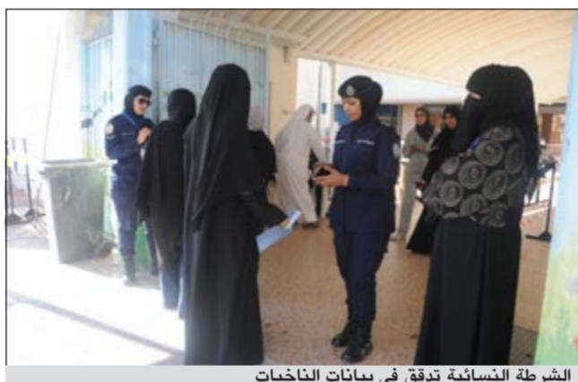
الشرطة النسائية تدقق في بيانات الناخبات