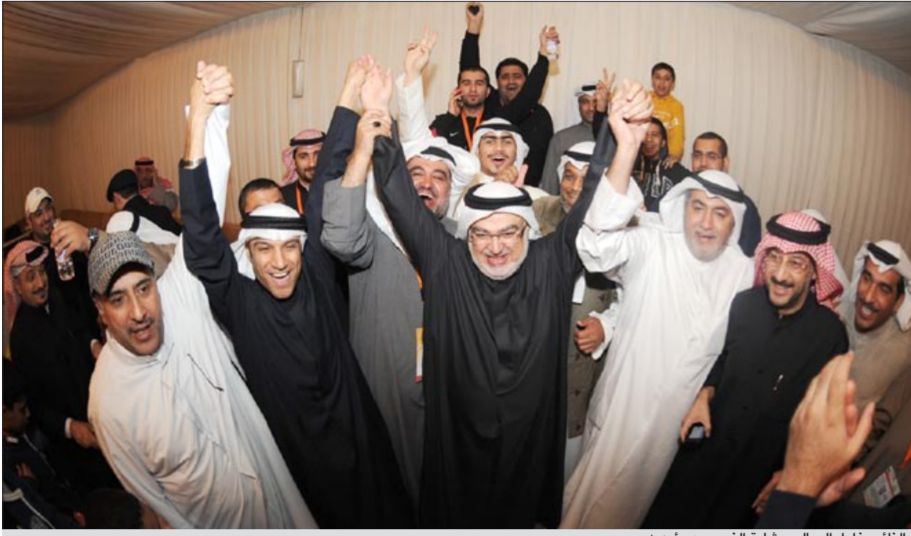
النائب خليل الصالح وشارة النصر مع مؤيديه