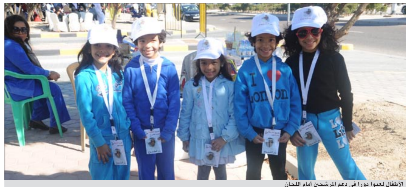
الأطفال لعبوا دورا في دعم المرشحين أمام اللجان