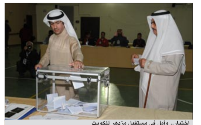
اختيار.. وأمل في مستقبل مزدهر للكويت