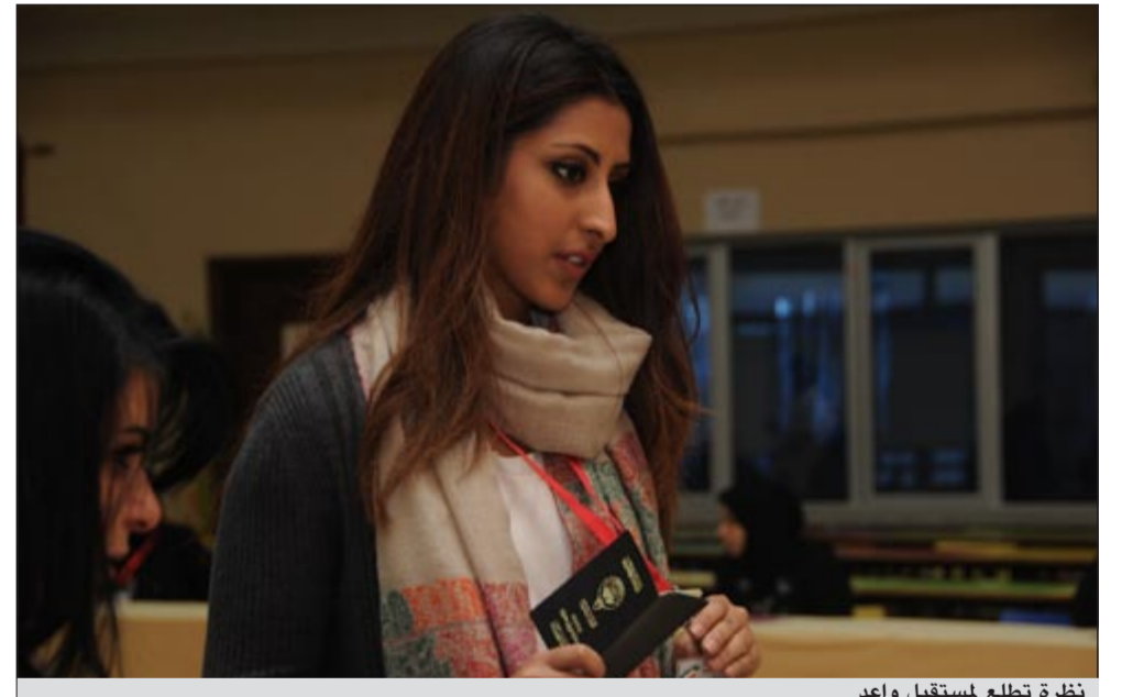
نظرة تطلع لمستقبل واعد