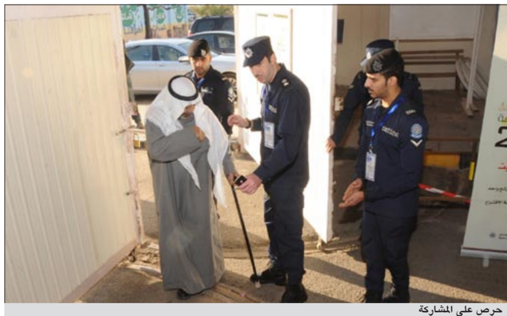
حرص على المشاركة