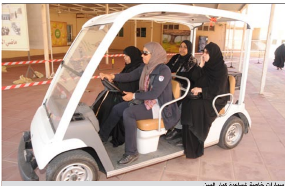
سيارات خاصة لمساعدة كبار السن