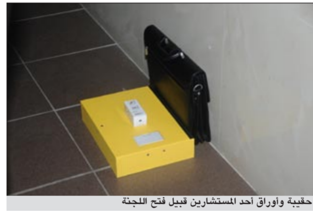
حقيبة واوراق أحد المستشارين قبيل فتح اللجنة