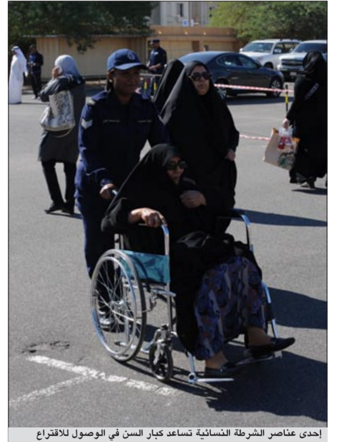
إحدى عناصر الشرطة النسائية تساعد كبار السن في الوصول للاقتراع

فريق العمل: مسعد حسني - رشيد الفهم - أمير زكي - حنان عبدالمعبود - رندى مرعي - لميس بلال - محمد راتب - ناصر الوقيت - بدر السهيل - أحمد عفيفي