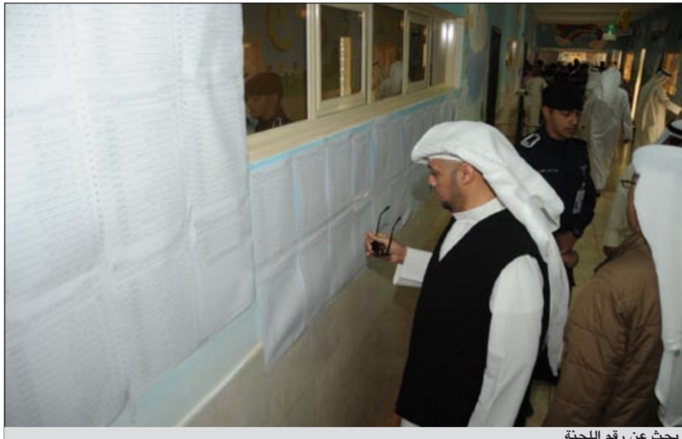
بحث عن رقم اللجنة