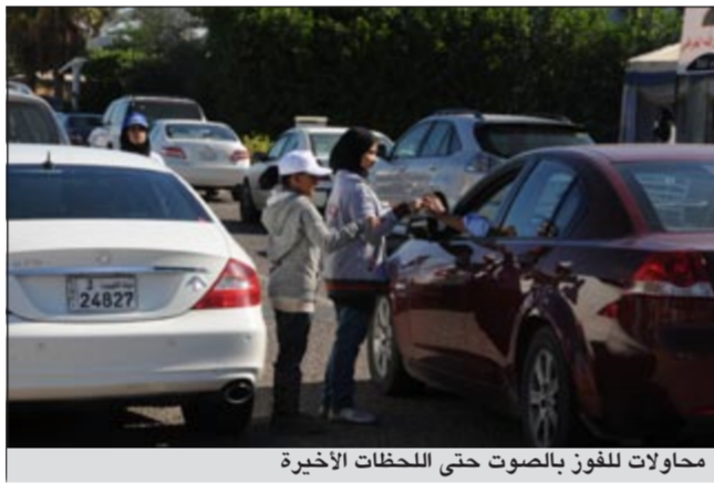
محاولات للفوز بالاصوت حتى اللحظات الأخيرة