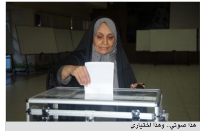
هذا صوتي.. وهذا اختياري