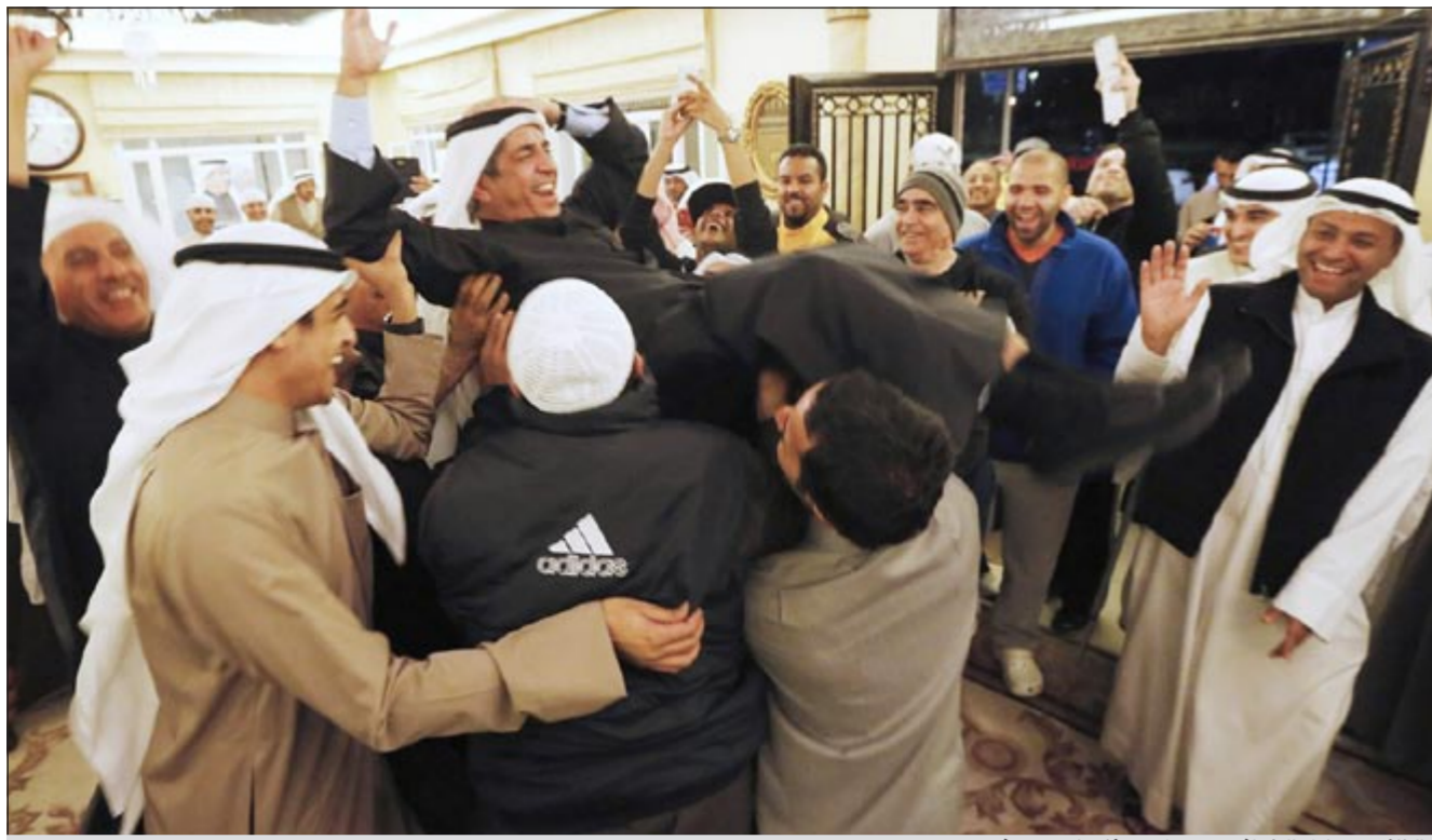
النائب م. عادل الخرافي محمولا من انصاره بعد فوزه