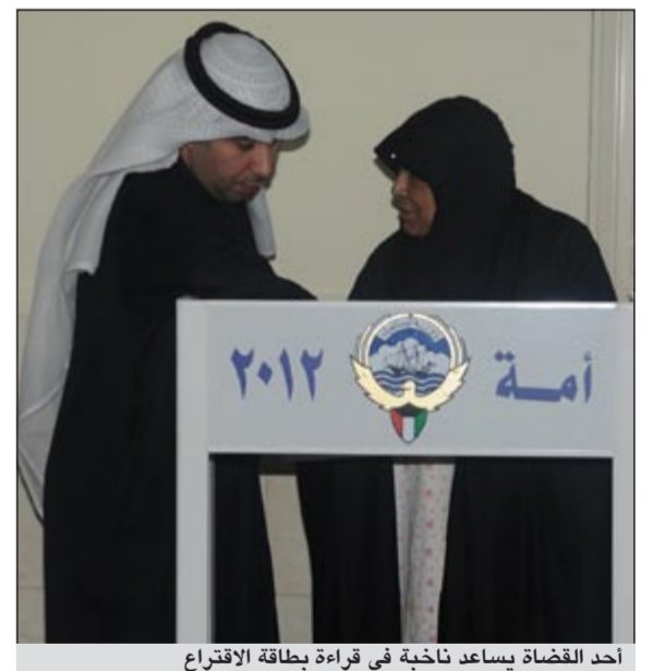
أحد القضاة يساعد ناخبة في قراءة بطاقة الاقتراع