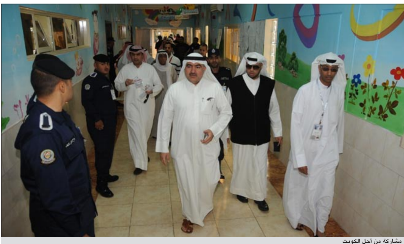
مشاركة من أجل الكويت