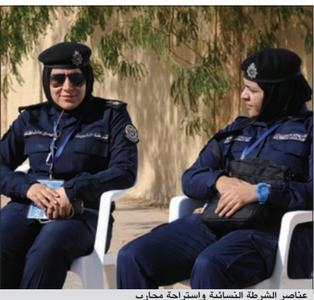
عناصر الشرطة النسائية واستراحة محارب