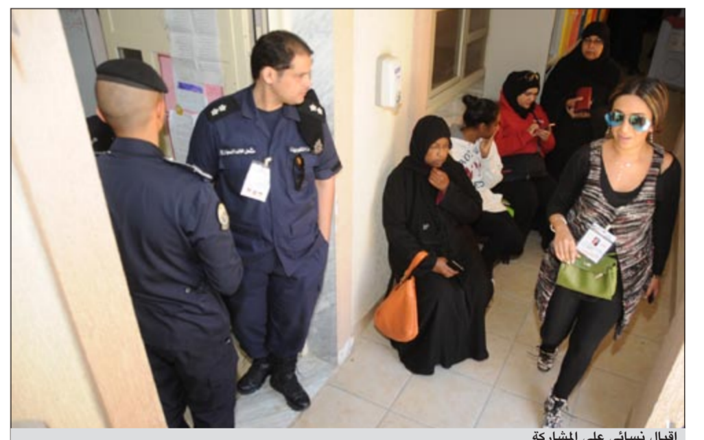
إقبال نسائي على المشاركة