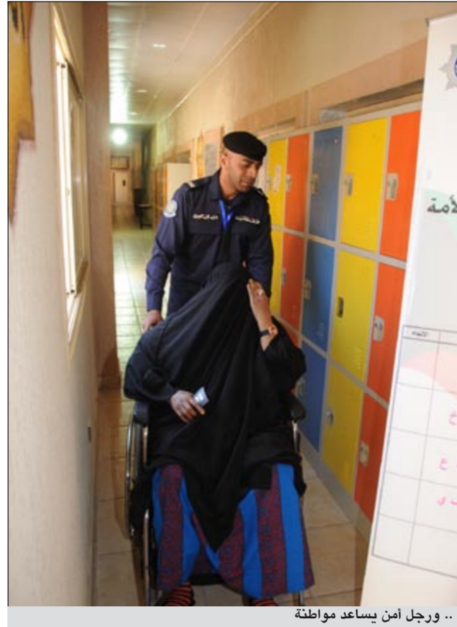
.. ورجل أمن يساعد مواطنة