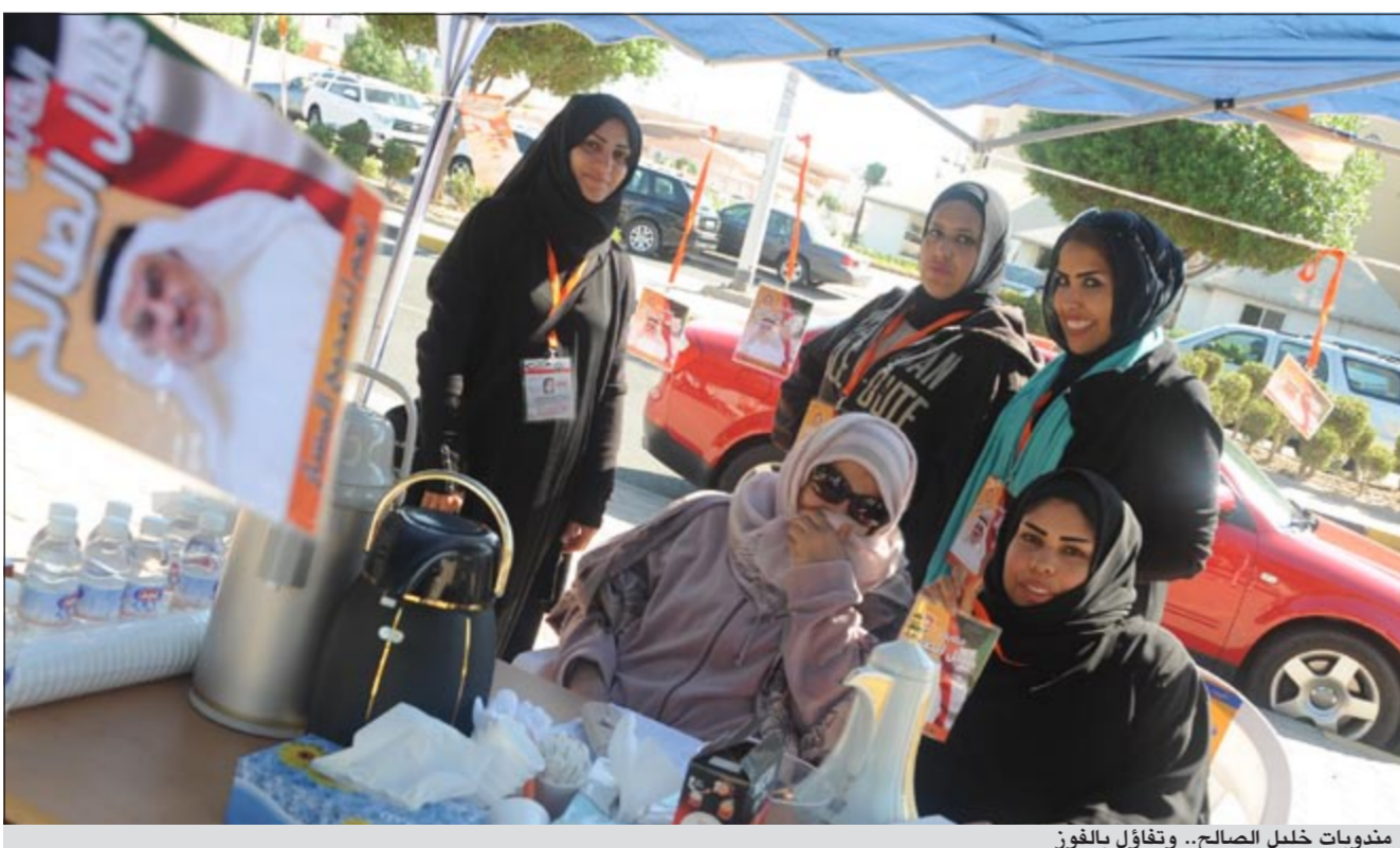
مندوبات خليل الصالح.. وتفاؤل بالفوز