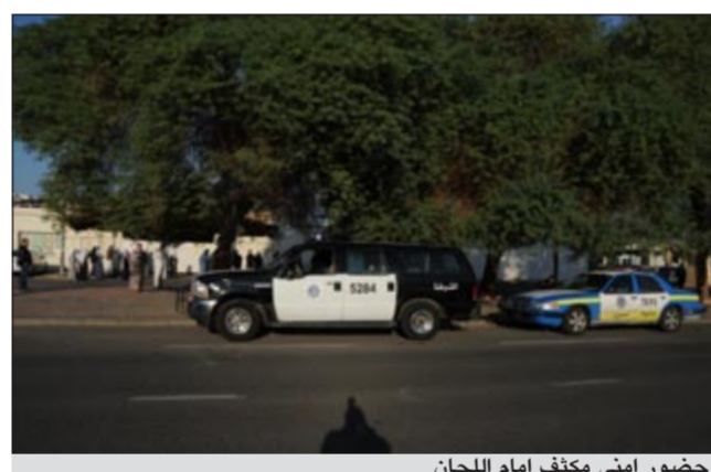
حضور امني مكثف امام اللجان