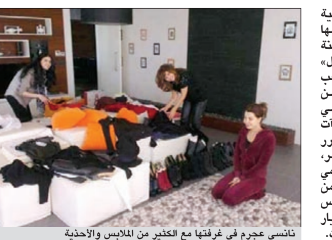
نانسي عجرم في غرفتها مع الكثير من الملابس والأحذية

أعربت النجمة اللبنانية نانسي عجرم عن تحمسها للاشتراك كعضو في لجنة تحكيم برنامج «أراب آيدول» في موسمه الثاني مع راغب علامة، وأحلام، وحسن الشافعي، ووعدت نانسي جمهورها بالكثير من المفاجآت خلال حلقات البرنامج المقرر عرضه قريباً على mbc مصر، ونشرت على حسابها الرسمي بموقع «تويتر» صورة لها من غرفتها مع الكثير من الملابس والأحذية التي بدأت في الاختيار من بينها لتسجيل الحلقات.