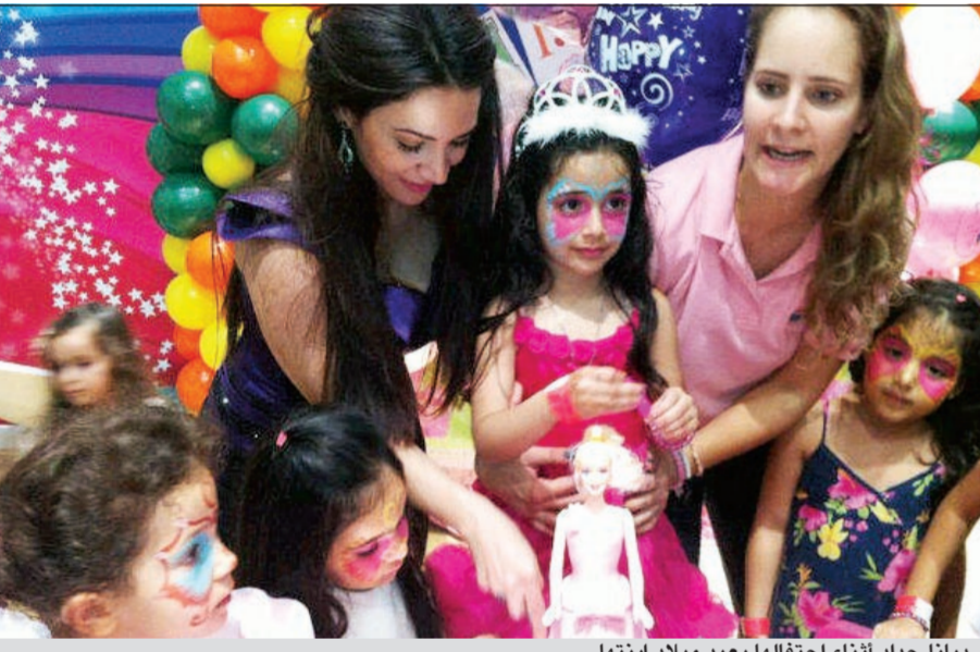
ديانا حداد أثناء احتفالها بعيد ميلاد ابنتها

ستحبيها في إمارة دبي، وذلك اليوم في القرية العالمية، التي يتسع مسرحها لعدد كبير من زوار القرية الكبير، وغدا الأحد تحيي حفل وزارة الثقافة الإماراتية في دبي، بمشاركة مجموعة من الفنانين، وذلك في ساحة أطول برج في العالم (برج خليفة)، والتي أهدت بها مسرحاً كبيراً يتسع لعدد كبير من الجمهور، حيث ستقدم في الحفلين برقة فرقة الموسيقى، مجموعة من أهم أغانيها القديمة والجديدة، من بينها أغنية «قلبي وفي» التي أطلقتها قبل أيام قليلة مصورة بطريقة الفيديو كليب مع المخرج جاد شويري.