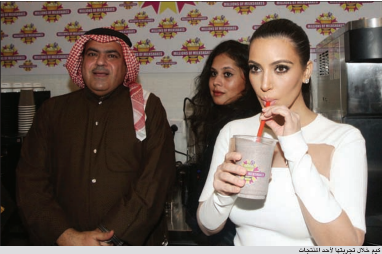
كيم خلال تجربتها لأحد المنتجات

كما زارت مجمع 52 ديفريز الذي يضم أحدث التصميمات في عالم الأزياء والعديد من المجالات التي تهتم بالمظهر الخارجي والجمال والأناقة، بحيث يقوم عليه مجموعة من الخبراء الكويتيين الذين توافرت لديهم أروع خيوط الجمال والذوق الشفاف.