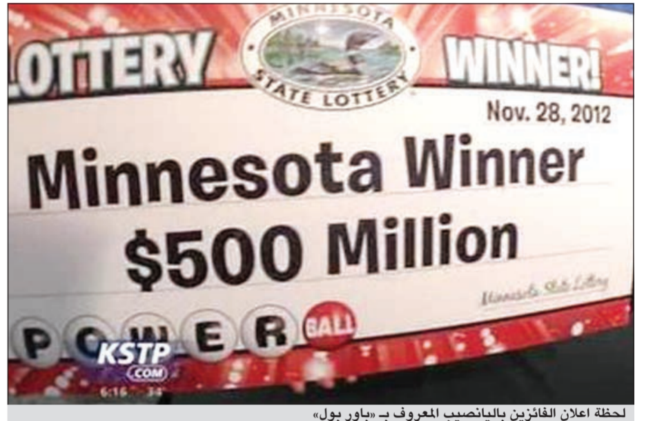
لحظة اعلان الفائزين بالانصيب المعروف بـ «باور بول»

واشنطن - أ.ف.ب.: فاز شخصان بالجائزة الكبرى وقدرها 550 مليون دولار في سحب الانصيب الأميركي المعروف بـ «باور بول»، محطمين رقماً قاسياً في تاريخ الانصيب في الولايات المتحدة، بحسب ما ذكر على موقع الانصيب الإلكتروني الأربعة. وتعتبر هذه الجائزة ثاني أكبر جائزة في تاريخ الانصيب الأميركي. وقد فاز 8,9 ملايين لاعب آخر بمبالغ أقل وصلت قيمتها الإجمالية إلى 131 مليون دولار خلال السحب.