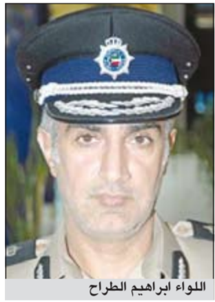
اللواء إبراهيم الطراح