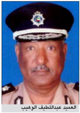
العميد عبداللطيف الوهيب

وذكر أن الخطة تعمل على اتخاذ جميع الإجراءات الأمنية العادية والاحترازية والوقائية لتأمين الانتخابات وحفظ الأمن والنظام في مواقع الاقتراع ومحيطها، وتأمين نقل صناديق الاقتراع وحمايتها وتزويد جميع العنقبات الإدارية والأمنية أمام سير عمل لجان الانتخابات، وتأمين وصول الناخبين إلى مواقع الاقتراع وتنظيم وتسهيل عملية دخولهم إلى هناك، والتعامل الفوري والحازم مع أي مظاهر من شأنها التأثير على العملية الانتخابية، والتصدي لأي محاولة للخروج على القانون حتى لا يكون هناك ما يشوب العملية الانتخابية. وأكد أن توجيهات القيادة العليا لوزارة الداخلية ممثلة في النائب الأول لرئيس مجلس الوزراء ووزير الداخلية الشيخ أحمد الحمود والتي يتابع تنفيذها وكيل وزارة الداخلية الفريق غازي العمر واضحة وصريحة في تقديم جميع التسهيلات وتزويد جميع العنقبات أمام جميع المواطنين من مرشحين وناخبين لتوفير المناخ الملائم لهذا الاحتفال الديموقراطي.