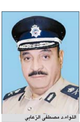
اللواء د. مصطفى الزعابي

الدورة عدد 10 متدربين بمركز التدريب التخصصي بقطاع شؤون المرور. وقد شارك في هذه الدورة مندوبة من قبل الأمم المتحدة حيث قامت بإعطاء محاضرات عن حقوق الإنسان، كما شارك أيضاً محاضر من مركز التدريب التخصصي للتحقيقات لإعطاء محاضرات عن كيفية التحقيق في الحوادث. تأتي تلك الدورة في الخطة التدريبية العامة لوزارة الداخلية لعام 2012-2013، وفي إطار حرصها الدائم على رفع كفاءة منتسبيها وتزويدهم بكل ما هو جديد.