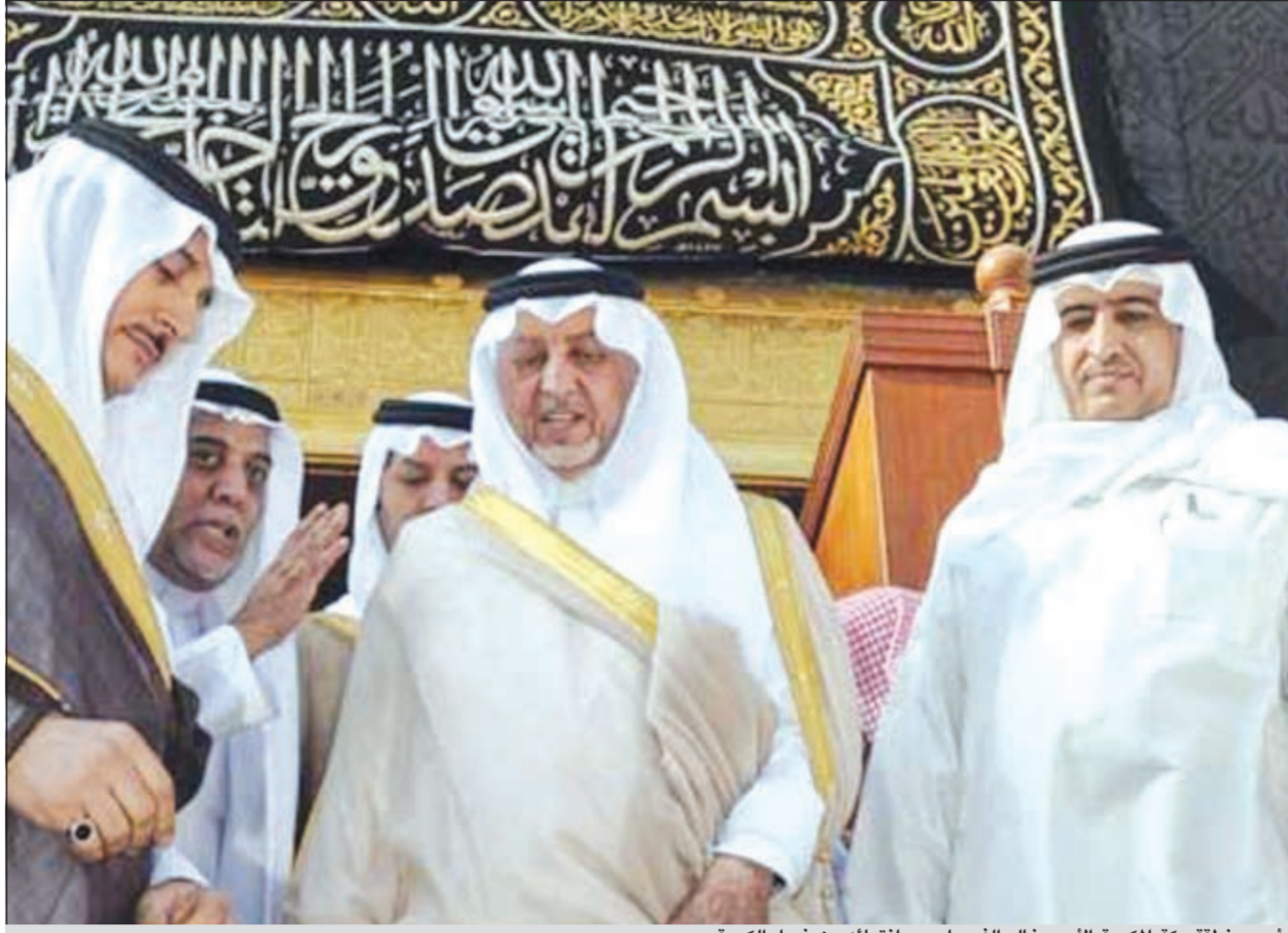
أمير منطقة مكة المكرمة الأمير خالد الفيصل بعد انتهائه من غسل الكعبة

على توفير كل مقومات الراحة والسلامة لهم ليستمتعوا بأداء المناسك في أجواء روحانية مفعمة بالإيمان.