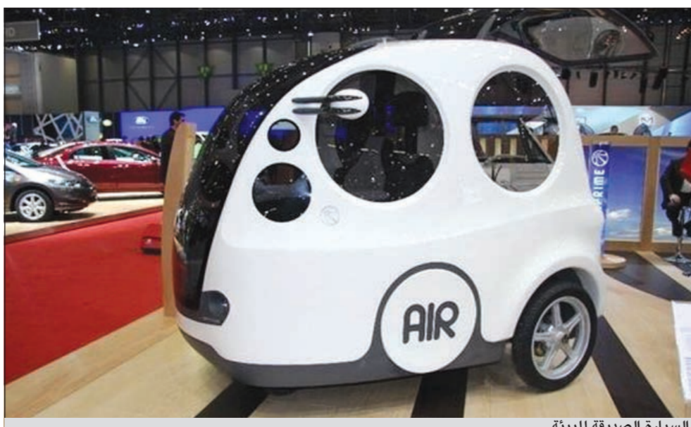
السيارة الصديقة للبيئة

الاختبارات الأولية فقد «لوحظ انخفاض مستوى استهلاك الوقود بنسبة تزيد على 20 ٪ ولا يزال العمل متواصلا لتحسين التصميم من أجل زيادة تحسين استهلاك الوقود».