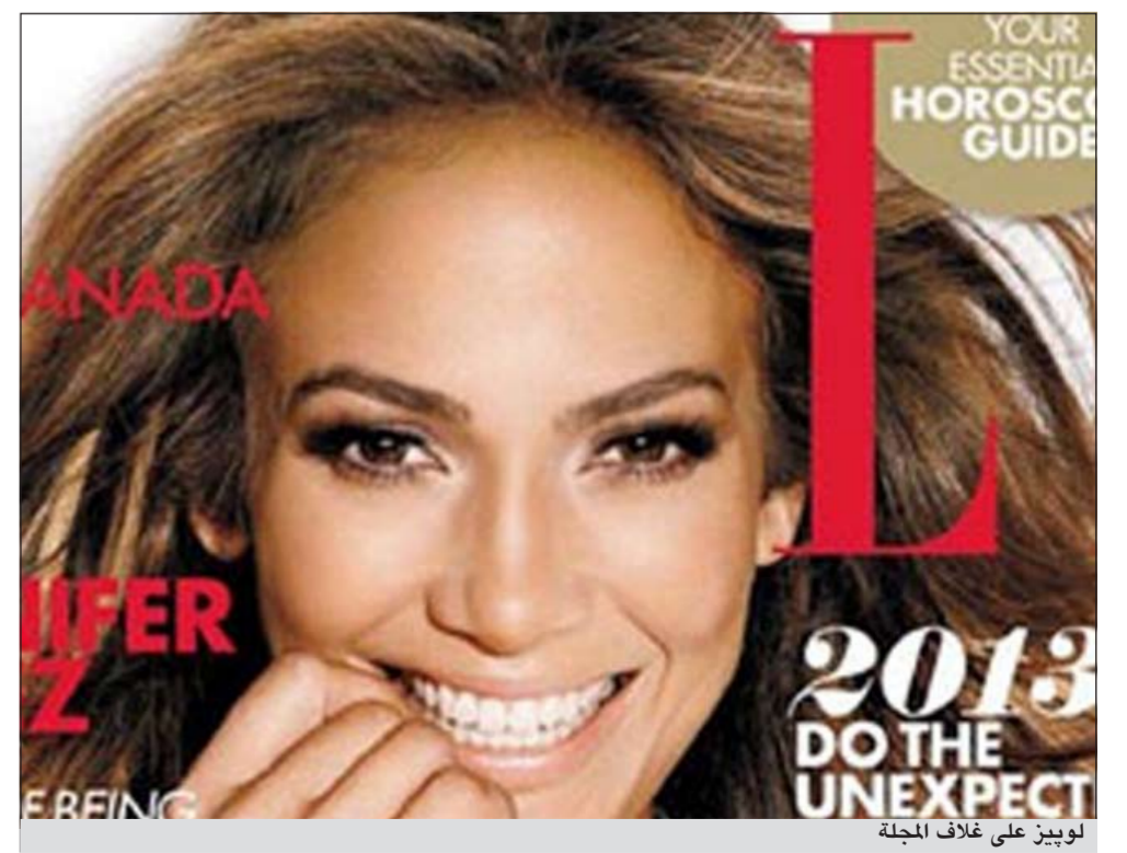
لوپيز على غلاف المجلة

وكالات: تتصدر النجمة العالمية جينيفر لوپيز (43 سنة) مجلة «ELLE» الكندية الصادرة لعدد يناير 2013، حيث تتحدث لوپيز للمجلة عن أطفالها، وتريزها الدائم على أن تكون قدوة لهم، وتعلمهم أنه بالعمل الجاد يستطيعون تنفيذ أي شيء بحياتهم، إضافة إلى ضرورة اهتمامهم بالأعمال الخيرية،