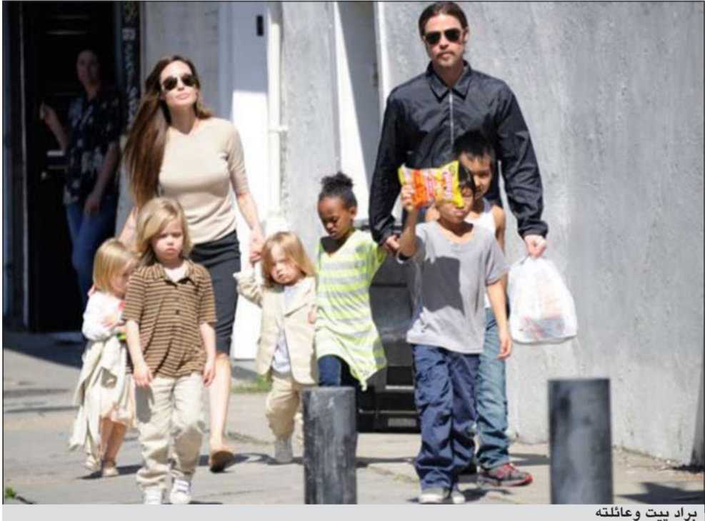
براد بيت وعائلته

بـ «برانجلينا»، من أكثر الأهداف الجاذبة لوسائل الإعلام في العالم. وأضاف براد بيت «لديهم شعور بالحياة الطبيعية هناك (فرنسا). لا نتعرض للمطاردة في أماكن بعينها... في فرنسا خاصة قواعد حول تصوير أطفال. واعتقد أنها أصبحت أكثر حساسية بعد وقوع حادث الأميرة ديانا».