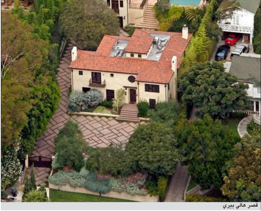
قصر هالي بيرى

اعتقل الأسبوع الماضي اثر شجاره في منزل هالي بيرى مع خطيبها الحالي أوليفيه مارتينيز استدعى نقلهما إلى المستشفى.