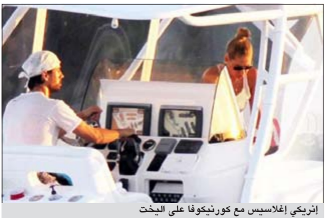
إنريكي إغلاسييس مع كورنيكوف على اليخت

لاحقت عدسات المصورين النجم الإسباني إنريكي إغلاسييس خلال اصطحابه لحبيبته لاعبة التنس الشهيرة آنا كورنيكوف في رحلة بحرية بيخت خاص في ميامي بولاية فلوريدا الأمريكية.