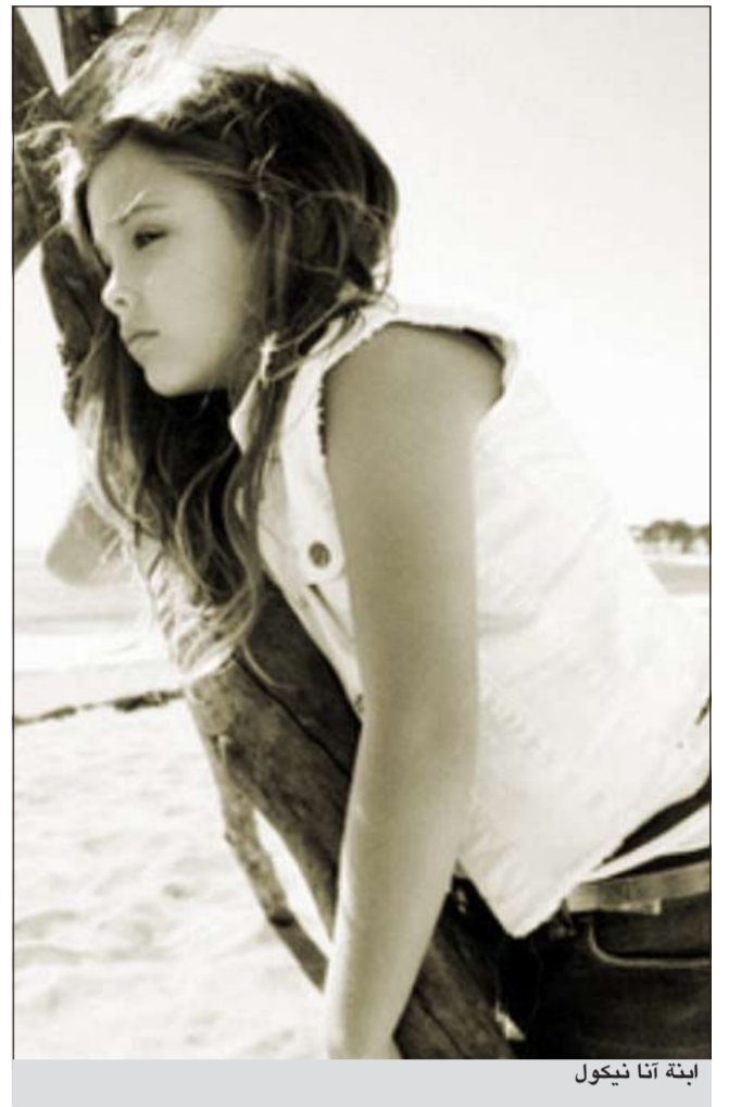
ابنة آنا نيكول

وفي الأشهر الأخيرة من حياتها واجهت سميث وفاة ابنتها الأكبر سنا بالإضافة إلى معركة قضائية حول ابنة ابنتها داني لين وحق حضانتها.