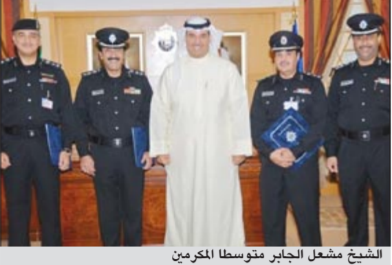
الشيخ مشعل الجابر متوسط المكرم

كرم وكيل وزارة الداخلية المساعد لشؤون تكنولوجيا المعلومات والاتصالات الشيخ مشعل الجابر كلا من: العقيد عادل محمد بن حسن والعقيد مشاري عبدالهادي المطيري والعقيد بحري فريد عبدالرحمن عبدالسلام من منتسبي القطاع. وقد أعرب الشيخ مشعل عن امتنانه البالغ لهؤلاء الضباط لما قاموا به من جهود مخلصه واسهامهم الملحوظ في ترسيخ قواعد العمل الأمني والتقني في البلاد في سبيل خدمة الوطن.