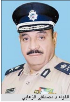
اللواء د.مصطفى الزعابي

دعا وكيل وزارة الداخلية المساعد لشؤون المرور اللواء د.مصطفى الزعابي قائدي المركبات الالتزام بالمادة 207 من قانون المرور التي تعطي الحق لأجهزة المرور بجواز حجز أي مركبة في حال وضعها كتابات أو ملصقات غير رسمية أو أعلاما أو صورا أو شعارات تدل على فئة أو طائفة أو جماعة. وقال د.الزعابي انه لوظف تنامي ظاهرة قيام بعض قائدي المركبات بوضع ملصقات ترمز الى بثت العنصرية الطائفية والقبلية والحزبية وغير ذلك من الكتابات والعبارات المسيئة للعادات والتقاليد والوحدة الوطنية والقيم الإسلامية السمحة.