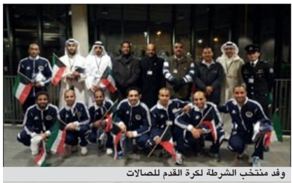
وفد منتخب الشرطة لكرة القدم للصالات