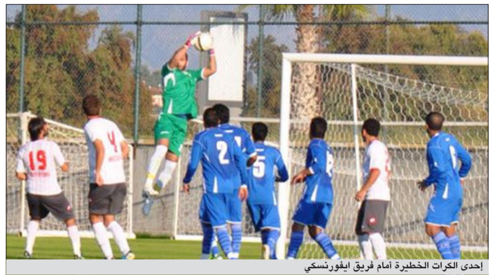
إحدى الكرات الخطيرة أمام فريق إيفورنسي