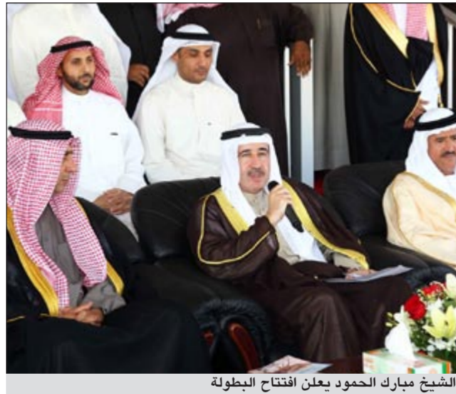
الشيخ مبارك الحمود يعلن افتتاح البطولة

وأضاف أن الاتحاد العربي لرياضة الهجن يضع جميع إمكاناته مع اللجنة المنظمة من أجل إنجاز البطولة. وأضاف أن البطولة هي ترسيخ لمنافسات سباقات الهجن وفق رؤية جديدة في مجال التنظيم والإدارة واهتمام الحكومات بتوفير المنشآت الحديثة لرياضة الأبناء والأجداد والحفاظ على التراث، وأشار إلى الجهود التي قام بها الشيخ سلطان بن حمدان آل نهيان رئيس اللجنة التنظيمية لسباقات الهجن بدول مجلس التعاون والعمل على النهوض بهذه الرياضة العربية الأصيلة والعمل المشترك بين دول المجلس من أجل تحقيق الإنجازات المشرفة نتيجة الدعم المتواصل الذي يجده قطاع الرياضة والشباب من الجميع.