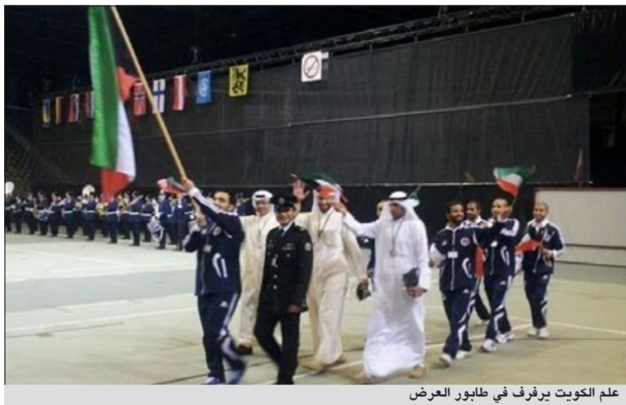
علم الكويت يرفرف في طابور العرض

اتحاد الشرطة المشارك حاليا في البطولة الدولية للصالات في بلجيكا العقيد وليد الغانم على ما بذله من جهد خلال فترة المعسكر التي سبقت البطولة حتى الآن وحرصه على راحة أعضاء الوفد واللاعبين من أجل الظهور بصورة مشرفة تعكس مستوى رجل الأمن الكويتي في هذا المحفل الدولي.