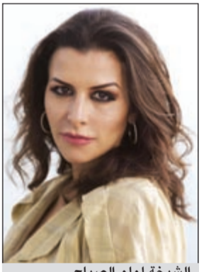
الشبيخة لولو الصباح