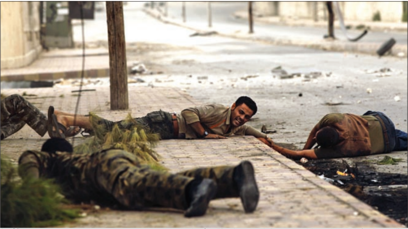
عناصر من الجيش السوري الحر يحاولون سحب مدني أصيب برصاص قناص في حلب

طائرات النظام تقصف «معصرة» زيتون في إدلب .. والجيش الحر يعلن إسقاط مروحية في ريف حلب