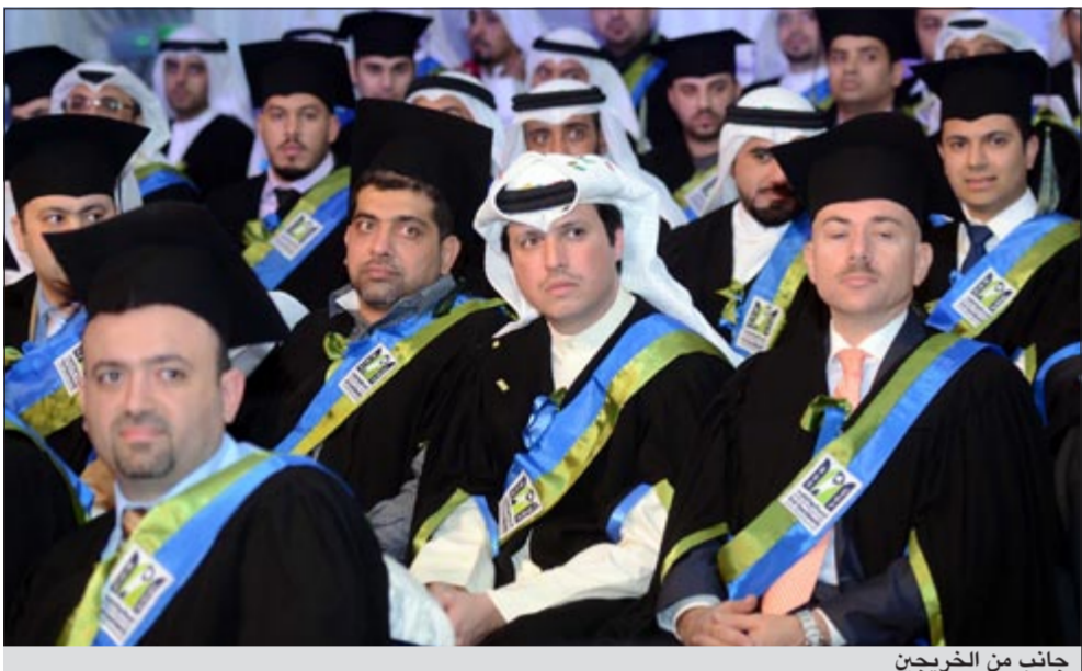
جانب من الخريجين