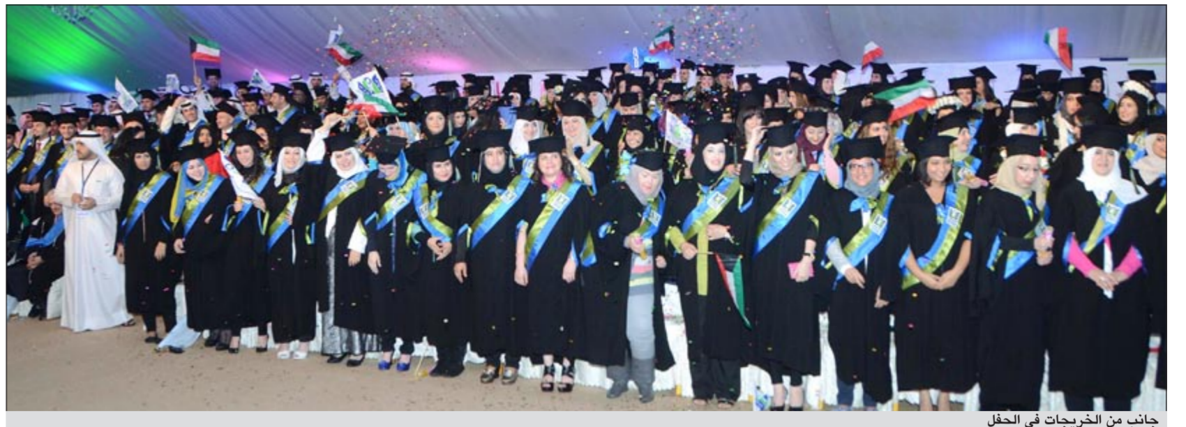
جانب من الخريجات في الحفل

خلال حفل برعاية الأمير طلال بن عبدالعزيز في مقر الجامعة الجديد بالعارضية