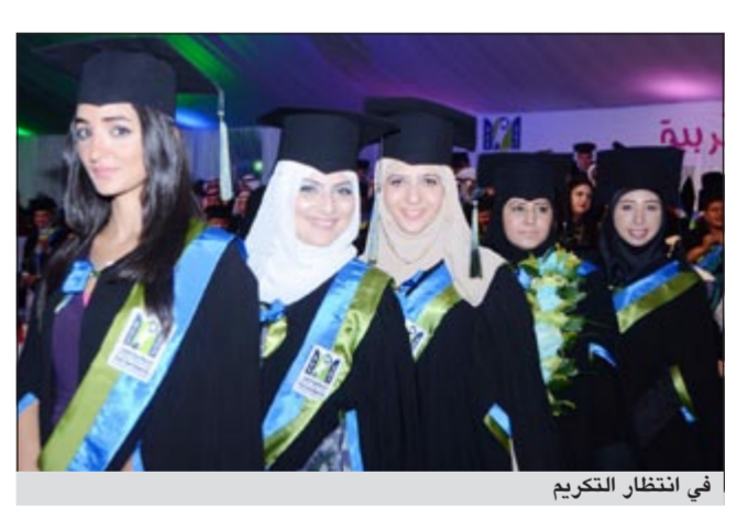
في انتظار التكريم

الجامعة العربية المفتوحة في الكويت حفلاً لتخريج دفعتها السابعة للعام 2011 - 2012 وبالبالغ عددهم 433 خريجاً وخريجة وذلك تحت رعاية رئيس مجلس أمناء الجامعة العربية المفتوحة الأمير طلال بن عبدالعزيز مساء أمس الأول في مقر الجامعة بمنطقة العارضية الصناعية.