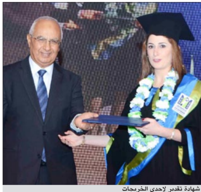
شهادة تقدير لإحدى الخريجات