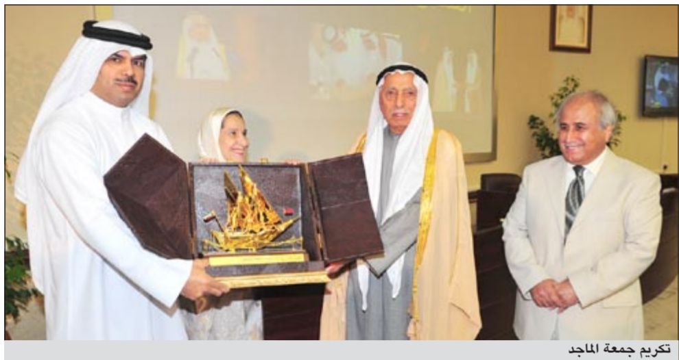
تكريم جمعة الماجد