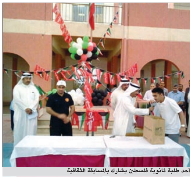
أحد طلبة ثانوية فلسطين يشارك بالمسابقة الثقافية