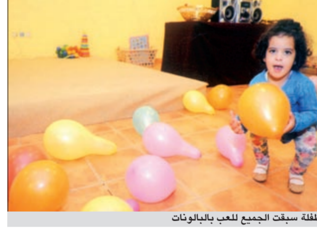
طفلة سبقت الجميع للعب بالبالونات

احتفل العالم بيوم الطفل، ونحن في الكويت احتفلنا به أيضا، لكن على استحياء، ليس لقلّة الجهات التي احتفلت به، وليس لما يبلغ فيه البعض من فخامة ما أقدم خلال الاحتفال، لكن تتساءل الى ماذا انتهى بعد هذا كله؟