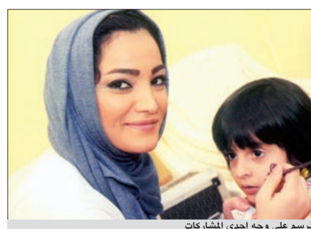
الرسم على وجه إحدى المشاركات

لذاته حتى ينتهي به العمر، ولا يمكن ان تحدث هذه الانتهاكات وهذه الجرائم على الطفل، إلا مع الإهمال وغياب الرقابة عليه من كل المصادر المحيطة به، من المنزل