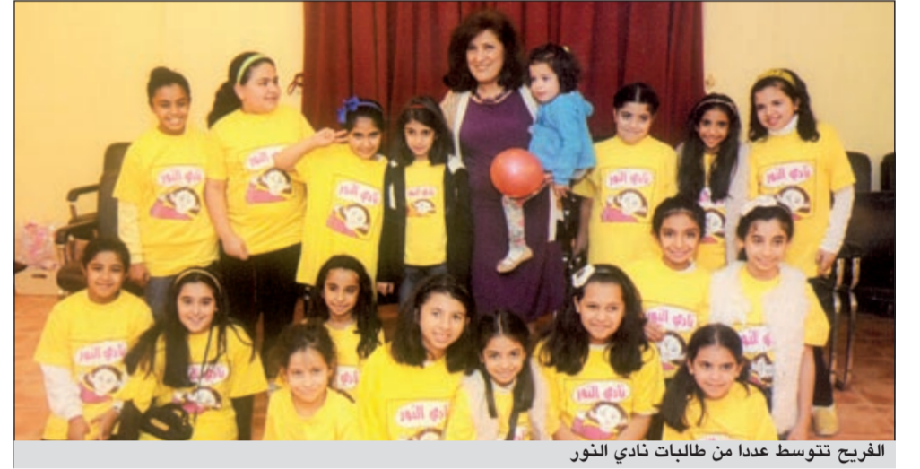
الفريخ تتوسط عددا من طالبات نادي النور

«حماية الطفل» ونستصرخ ضمير ذوي الشأن فيه، من السلطة التنفيذية (الحكومة) وانتهاء إلى السلطة التشريعية. (مجلس الأمة) وإن كان معطلا في هذه الأيام فنحن نلغي باللائمة على أعضائه نساء ورجالا في دوراتهم السابقة، ولا نمنحهم العذر، لأنهم أغفلوا هذه القضية ولم يأخذوها بعين الاهتمام في الدفع بوضع قانون الطفل، وإن كان ما سمعناه أو قرأناه للبعض بالنادي بوضع مقترحات قوانين، لا تتعدى مسالة سد العجز، بعد الحاجتنا المتواترة، أو قد تكون لدى البعض الآخر من باب البهجة الإعلامية، والأوراق السياسية لاغير.