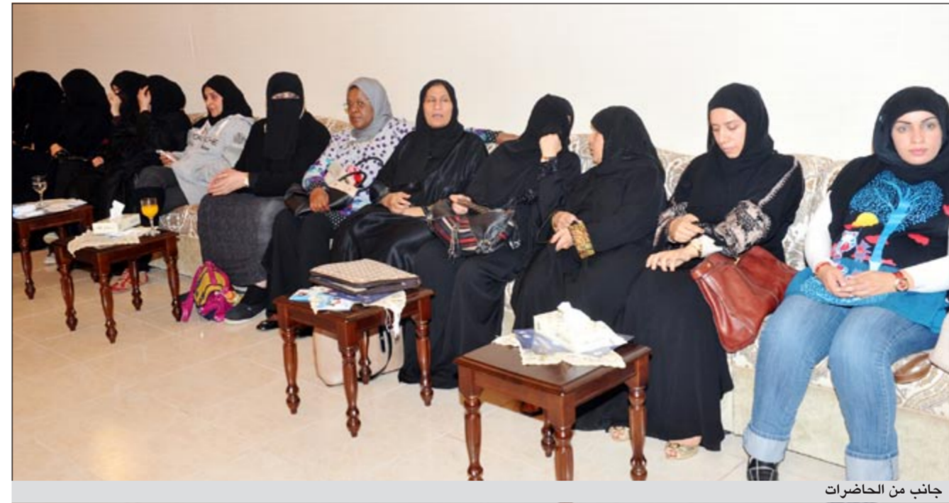
جانب من الحاضرات

اعضاء من الأقب وشبهات، وأشار الى ان هناك من يقول اليوم ان المجلس القادم غير شرعي ولكن من يطلقون هذه الاقاويل ليسوا من الفقهاء بل هم اناس تلاشت مكاسبهم من