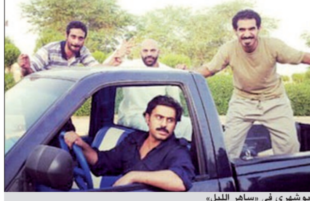
بوشهري في «ساهر الليل»