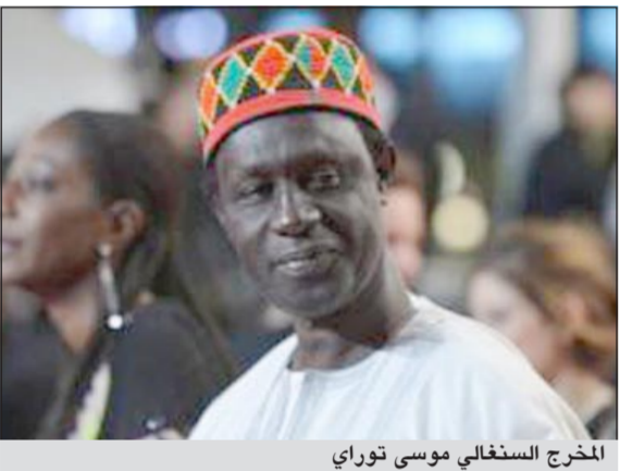
المخرج السنغالي موسى توراي

تونس - يو.بي.أي: أسدل الستار على فعاليات الدورة الـ 24 لأيام قرطاج السينمائية بفوز الفيلم السنغالي الطويل «الزورق» للمخرج موسى توراي بجائزة «التانيت الذهبي». وحصل على جائزة «التانيت الفضي» لمسابقة الأفلام الطويلة فيلم «موت للبيع» للمخرج المغربي فوزي بن سعدي فيما منحت جائزة «التانيت البرونزي» لفيلم «الخروج إلى النهار» للمخرجة المصرية هالة لطفى. أما جوائز مسابقة الأفلام القصيرة فقد فاز بجائزة «التانيت الذهبي» الفيلم المغربي «حياة قصيرة»، للمخرج عبد الفضلي فيما فاز بجائزة «التانيت الفضي» فيلم «تدافع 9 أبريل 1938» لطارق الخلاوي وسوسن سابا من تونس وأسندت جائزة «التانيت البرونزي» لفيلم «ليزا» لماري كليمينت جامبو من رواندا. وتوزعت جوائز مسابقة الأفلام الوثائقية الطويلة على فيلم «الرئيس ديا» لعصمان وليام ميايم من السنغال «التانيت الذهبي»، فيلم «العزراء والأباط» و«أنا» لتمير عبد المسح من مصر «التانيت الفضي»، وفيلم «كل هذا وأكثر» لوسام شرف من لبنان «التانيت البرونزي».