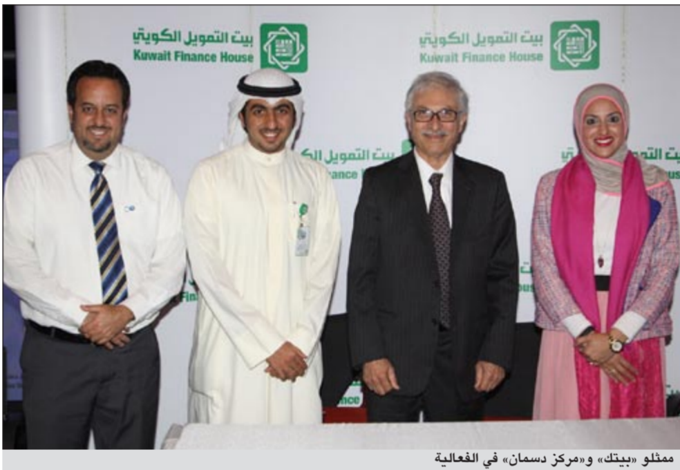
مغللو «بيتك» و«مركز دسمان» في الفعالية

حظيت فعالية اليوم المفتوح برعاية «بيتك» وبتنظيم معهد دسمان للسكر بمناسبة يوم السكر العالمي بحضور أكثر من ألف مشارك من مختلف الأعمار من المواطنين والمقيمين، حيث اشتمل البرنامج على عدة فقرات صحية وتعليمية وترفيهية شيقة، وأقيم على هامش الفعالية معرض خاص بتعريف المشاركين بأمراض السكري وطرق الوقاية منها وأتيحت لهم فرصة الفحص المجاني مع إعطائهم النصائح الكافية لتجنبهم الآثار السلبية للمرض، كما تم تقديم فقرات ترفيهية وسباقات للصغار علاوة على محاضرات توعوية تخص التغذية السليمة. ويأتي اهتمام «بيتك» بدعم التوعية والوقاية من أمراض السكر للعام الرابع على التوالي ضمن مسؤوليته الاجتماعية في المجال الصحي، حيث نظم خلال