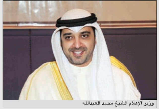
وزير الإعلام الشيخ محمد عبدالله