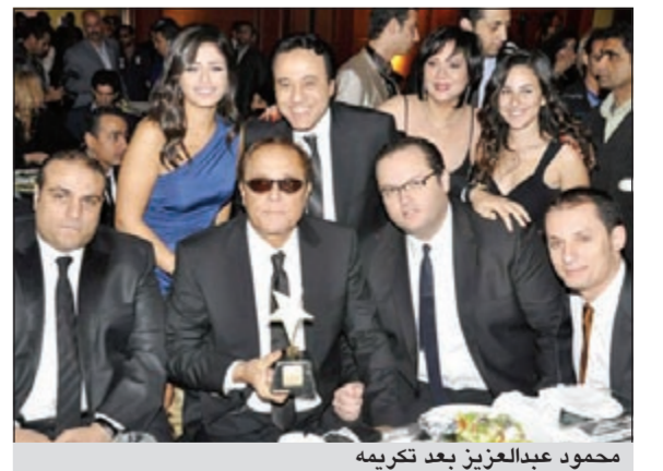
محمود عبدالعزيز بعد تكريمه

في مهرجان القنوات الفضائية العربية تم اختيار «الساحر» محمود عبدالعزيز بإجماع لجنة التحكيم وآراء الجمهور كأحسن فنان في الوطن العربي لعام 2012 عن دوره في مسلسل «باب الخلق» وتم تكريم أسرة العمل عن أدائهم المميز وتكريم شركة مجموعة فنون مصر والمنتجين ريمون وقار ومحمد محمود عبدالعزيز كأحسن إنتاج درامي.