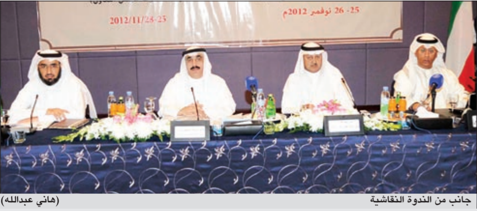
جانب من الندوة النقاشية (هاني عبدالله)