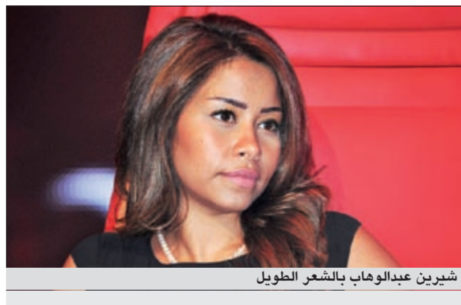
شيرين عبد الوهاب بالشعر الطويل

أثار التوصيف الذي أطلقه أسامة الرحباني في السهرة الرابعة من الموسم الثالث لبرنامج «ديو المشاهير» التي عرضت مساء السبت الماضي على شاشة الـ LBC والذي أطلق عبارات وصف فيه مقدمة البرامج كارولينا دي أوليفيرا بـ«الشنتيرة»، أي الفارغة الطول وهي ليست المرة الأولى التي ينتقد فيها طولها وإطاللتها على المسرح سخطاً كبيراً في الوسط الإعلامي والجماهيري. ولكن أوليفيرا ردت عليه طالبة منه عدم توجيه هكذا عبارات لها، خصوصاً أنها ليست المرة الأولى إذ أنه وصفها سابقاً بالمشاحنة، وهي لم تعد تحتفل مثل هذه التعابير على الهواء.