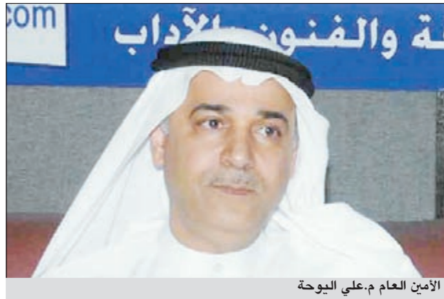
الأمين العام م. علي البوينة

الثلاثاء 12/28، يعقبا حفل الختام لتوزيع الجوائز في يوم الأربعاء 12/19 وتضم أنشطة المهرجان عقد ندوة فكرية تحمل عنوان: «دور مهرجانات المسرح في دول مجلس التعاون في تطوير الحركة المسرحية الخليجية»، والتي تتكون من ثلاثة محاور (النص المسرحي، الرؤية الإخراجية، الخطاب النقدي) يحاور فيها عدد من الشخصيات الأكاديمية المتخصصة في مجال الكتابة الدرامية والإخراج والنقد المسرحي من الكويت ودول مجلس التعاون الخليجي، وتنظم هذه الندوة على يومي 12/12 و 12/13 في العاشرة صباحاً في مقر إقامة الضيوف.