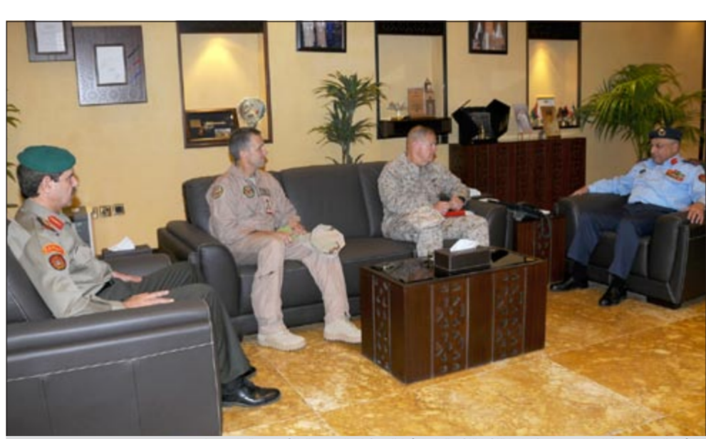
الفريق الركن خالد الجراح خلال لقائه قائد قيادة فيلق مشاة البحرية الأميركية الوسطى

استقبل رئيس الأركان العامة للجيش، الفريق الركن خالد الجراح بكنيته صباح أمس، قائد قيادة فيلق مشاة البحرية الأميركية الوسطى الفريق روبرت تالار والوفد المرافق له، وذلك بمناسبة زيارته للبلاد. حيث تم مناقشة أهم الأمور والمواضيع ذات الاهتمام المشترك، لاسيما المتعلقة بالجوانب العسكرية، وسبل تطويرها وتعزيزها بين البلدين الصديقين.