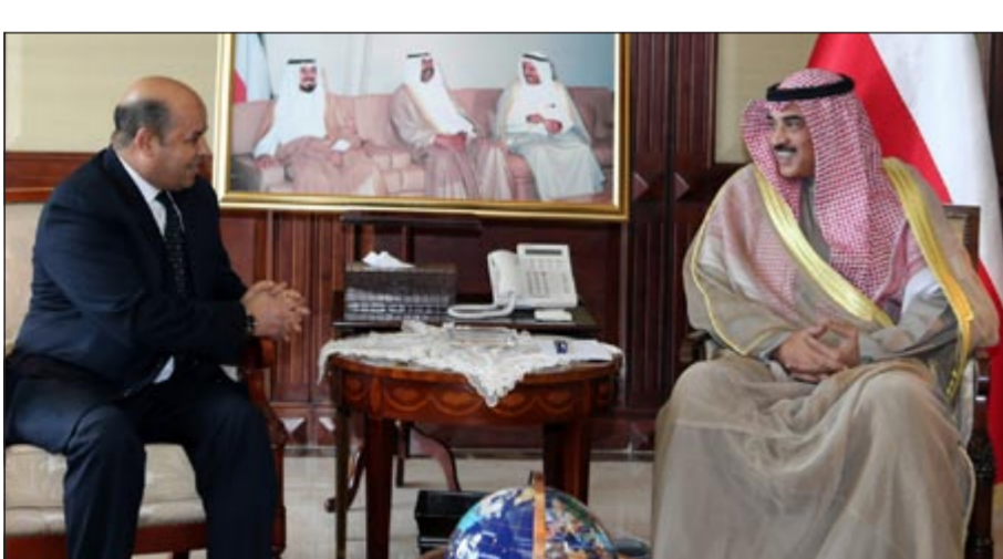
الشيخ صباح الخالد خلال لقائه السفير التونسي الصغير الفطاسي

الخارجية خالد الجارالله ومدير إدارة مكتب نائب رئيس مجلس الوزراء ووزير الخارجية السفير الشيخ د. أحمد ناصر المحمد ومدير إدارة المراسم السفير ضاري العجران. كما استقبل الشيخ صباح الخالد كلا من سفير جمهورية كوريا الديمقراطية الشعبية لدى الكويت هو جونج وسفيرة جمهورية جورجيا لدى الكويت إيكاترين مابرينج مكداردا كلا على حدة وذلك بمناسبة انتهاء فترة عملهما كسفراء لبلديهما لدى الكويت. وانشاد الشيخ صباح الخالد بدور السفيرين هو جونج وإيكاترين مكداردا في تعزيز العلاقات الثنائية بين بلديهما والكويت طوال فترة عملهما متمنيا لهما التوفيق والسداد في حياتهما المهنية والعملية.