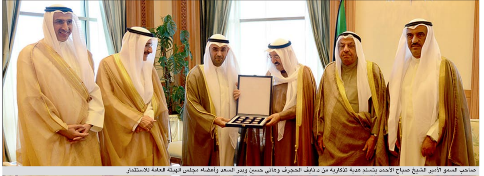
صاحب السمو الأمير الشيخ صباح الأحمد يتسلم هدية تذكارية من دنايف الحجرف وهاني حسين ويدر السعد وأعضاء مجلس الهيئة العامة للاستثمار

متمنيا له موفور الصحة ودوام العافية. وبعث سمو ولي العهد الشيخ نواف الأحمد ببرقية تهنئة إلى الرئيس نيبوشيا راما نوفيتش رئيس رئاسة البوسنة والهرسك الصديقة، عبر فيها سموه عن خالص تهانئه بمناسبة العيد الوطني لبلاده، متمنيا له موفور الصحة ودوام العافية، كما بعث سمو رئيس مجلس الوزراء الشيخ جابر المبارك ببرقية تهنئة.