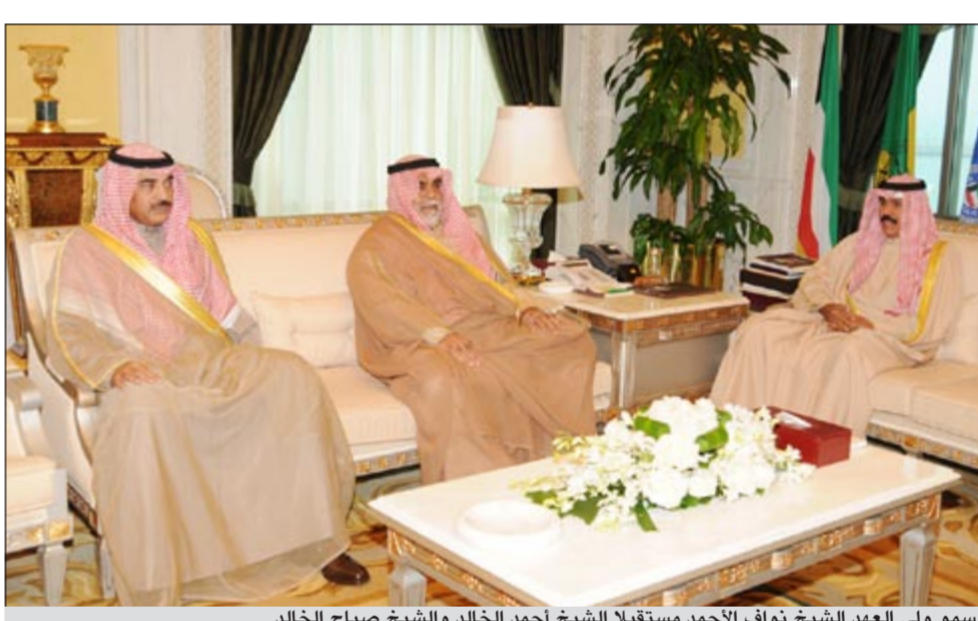
سمو ولي العهد الشيخ نواف الأحمد مستقبلا الشيخ أحمد الخالد والشيخ صباح الخالد

على إنشاء مكتب الاستثمار في لندن. وقد أثنى سموه على الجهود المبذولة من القائمين على المكتب وعملهم الدؤوب مؤكداً دورهم الفاعل في تعزيز العلاقات الثنائية في قطاع الاستثمار بين الكويت والمملكة المتحدة بما يخدم القطاع الاقتصادي للبلاد ويحقق رؤية صاحب السمو الأمير في جعل الكويت مركزاً مالياً وتجاريًا. كما أكد سموه أن الاقتصاد هو الركيزة الأساسية لجميع الدول في تحقيق التنمية الشاملة والازدهار المنشود على المستويين الإقليمي والدولي.