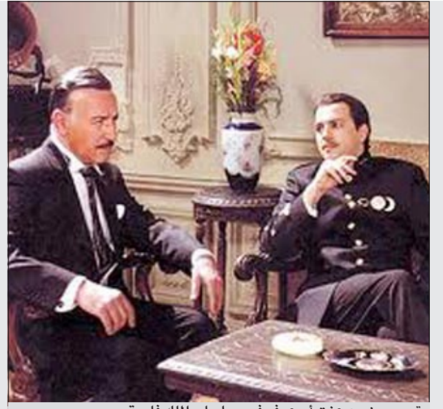
تيم حسن مع عزت أبو عوف في مسلسل «الملك فاروق»