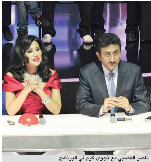
ناصر القصبي مع نجوى كرم في البرنامج

انسحب الفنان السعودي ناصر القصبي من لجنة تحكيم الموسم الثالث من برنامج «آراب غوت تالنت»، والذي سيعرض قريبا على شاشة mbc، فيما يتم التفاوض حاليا مع عدد من الفنانين الخليجيين والمصريين للانضمام للجنة التحكيم التي تتألف من الفنانات اللبنانية نجوى كرم والاعلامية علي جابر (بحسبما ورد في مجلة سيدتي).