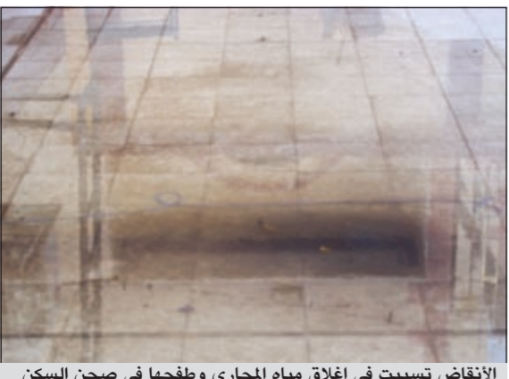
الانقاض تسببت في إغلاق مياه المجاري وطفحها في صحن السكن

وأضاف أنه قام بإبلاغ مراقب الصيانة عدة مرات في حينها، لكن «لا حياة لمن تنادي»، لافتاً إلى أن مشكلة المجاري مستمرة إلى الآن، والمياه الوسخة والأنقاض موجودة في صحن العقار، والوضع الداخلي لسكن إمام المسجد كما هو منذ حوالي سنة كاملة فترجو ممن يهيمه الأمر سرعة الاستجابة لبلاغنا هذا.