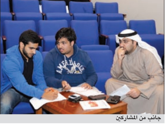
جانب من المشاركين

نظمت اللجنة العليا لدوري مناظرات كليات جامعة الكويت باللغة العربية في نسخته الثانية اللقاء التعريفي الأول للمشاركين، بحضور عميد شؤون الطلبة د. عبدالرحيم ذياب ومساعد عميد شؤون الطلبة للخدمات الطلابية ورئيس اللجنة العليا للمناظرات د. هيفاء الكندري وأعضاء لجان التحكيم والتدريب والإدارية وكذلك الطلبة المشاركون. وأكد د. عبدالرحيم ذياب أن دوري مناظرات كليات جامعة الكويت يعتبر من أنجح أنشطة عمادة شؤون الطلبة التي لاقت نجاحاً باهراً في موسمها الأول والتي كانت تحت رعاية وحضور وزير التربية ووزير التعليم العالي د. نايف الحجرف، وذلك بهدف الارتقاء بمستوى ثقافة الحوار بين طلبة جامعة الكويت، قائلاً: اكتشفنا وجود طاقات طلابية ناضجة فكرياً وقادرة على المحاوراة الإيجابية وتقبل الرأي والرأي الآخر بكل رقي. وذكر أن عمادة شؤون الطلبة بصدد إقامة دوري المناظرات باللغة العربية على مستوى مؤسسات التعليم العالي في الكويت في الفصل الدراسي القادم، بالإضافة إلى المشاركة في دوري مناظرات قطر في إبريل المقبل.