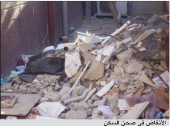
الانقاض في صحن السكن

أعرب أحد الأئمة الساكنين بمنطقة العديلية عن استنكاره الشديد من الإهمال الذي يعاني منه سكن الأئمة من قبل مراقبة الصيانة، مما يهدد حياة قاطنيه ويعرضهم للإصابة بالأمراض الخطيرة.