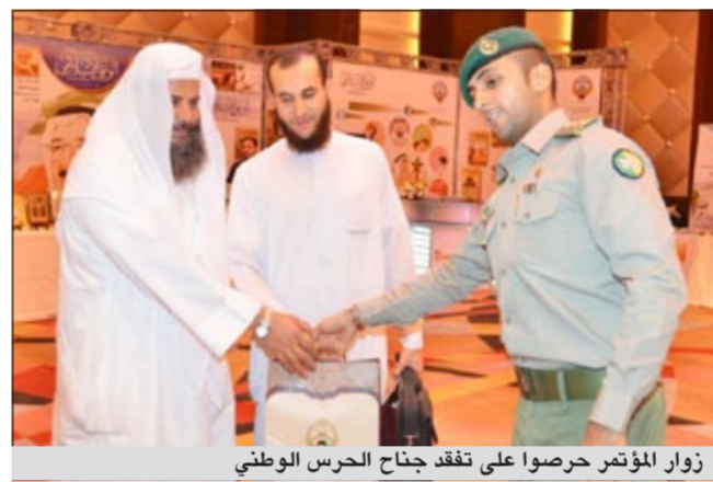
زوار المؤتمر حرصوا على تفقد جناح الحرس الوطني