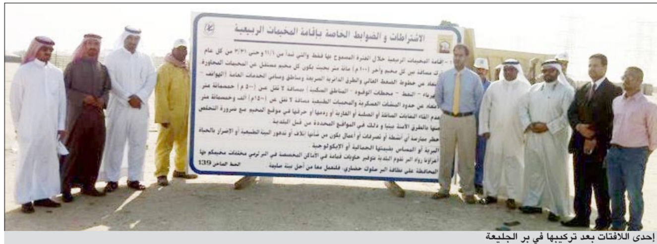
إحدى لافتات بعد تركيبها في بر الجليعة