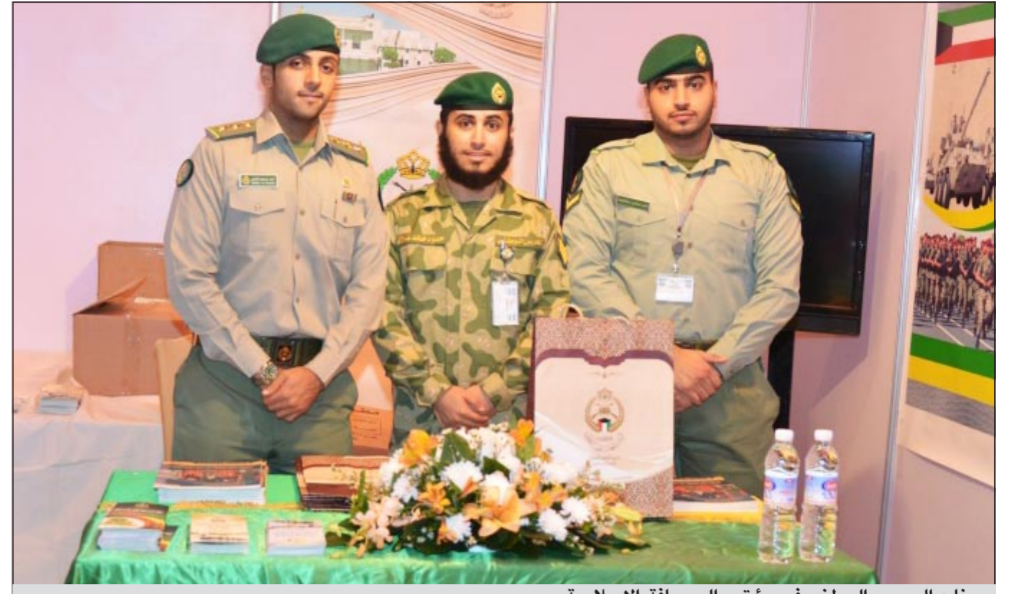
جناح الحرس الوطني في مؤتمر الصحافة الإسلامية