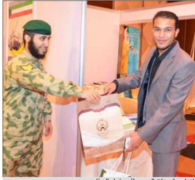
إهداء مطبوعات الحرس لأحد زوار جناح

شدد الأمين العام لهيئة الملتقى الإعلامي العربي ورئيس الجمعية الكويتية للإعلام والاتصال ماضي الخميس على ضرورة توفير الحماية الدولية التامة للصحفيين العاملين في الأماكن المصنفة على أنها مناطق خطرة بالنسبة للصحفيين والإعلاميين. لا يجوز أبداً أن يدفعوا حياتهم ثمناً لنقل المعلومة أو الخبر، بل على العكس تماماً يجب أن تكون أرواحهم محمية من الأخطار كبرت أو صغرت لعظم المهمة التي يقدمونها للعالم. ولفت الخميس إلى أهمية دور الحكومات والدول والمؤسسات الدولية في توفير آليات الحماية المناسبة للصحفيين والإعلاميين العاملين في مناطق التوتر، لأنه لا بد أن تكون هناك سبل محددة لحمايتهم من جميع الأخطار التي من الممكن أن يواجهوها خلال عملهم الصحفيين. وكان الاتحاد الدولي للصحفيين قد أكد على أن اليوم العالمي لمكافحة إقالات قتل الصحفيين من العقاب الذي أقامه الاتحاد للمرة الأولى الخميس الماضي 22 الجاري يعتبر «صرخة تنبيه لجميع الحكومات حول العالم لوقف العنف الذي يستهدف الصحفيين ومعاييره مرتكبيه». وأشار الاتحاد في بيان صحافي إلى أن الصحفيين