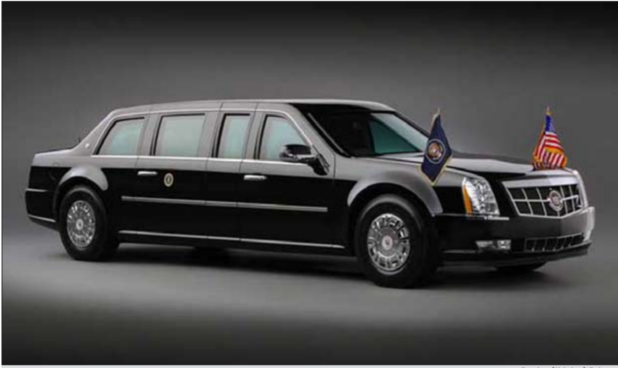
سيارة أوباما الأسطورة

عند تمرّرها. كما يوجد في السيارة تزويدات خاصة مثل بذوقية من نوع بامب اكشن ومدفع غازي وكاميرات رؤية مسائية ومعادن سمكه خمس بوصات لمنع تفجير السيارة من أسفل، وتلفون ستايليت وخط مباشر بناطئ الرئيس والنيانغون، أيضا خزّان وقود مصفّح معالج ضد الانفجار وحجرة قيادة مزودة بمركز اتصالات ونظام «GPS»، اما اطارات السيارة فهي من نوع آر.تش.اس ويبلغ قطرها 19,5 بوصة وهي مؤهلة لمقاومة الثقوب والهزّ حتى الهجمات.