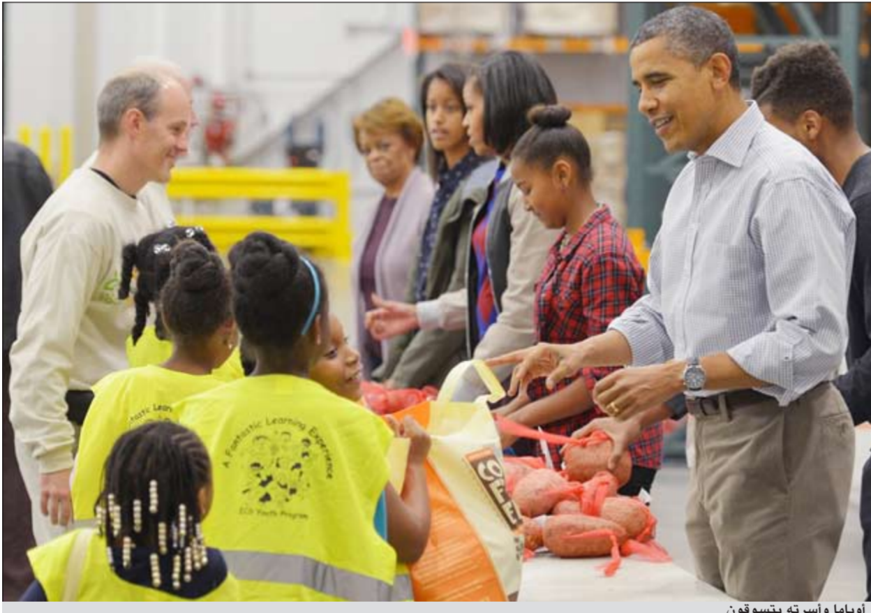
أوباما وأسرته يتسوقون

الطيران بتقديم الامام» في الانتخابية «الامام». وهذا التقليد معتمد في البيت الأبيض منذ عهد الرئيس جون كينيدي. وقد عفا الرئيس أوباما عن الديكين الروميين بحضور ابنته ساشا ومالبا. وعيد الشكر من أهم الأعياد الأميركية.