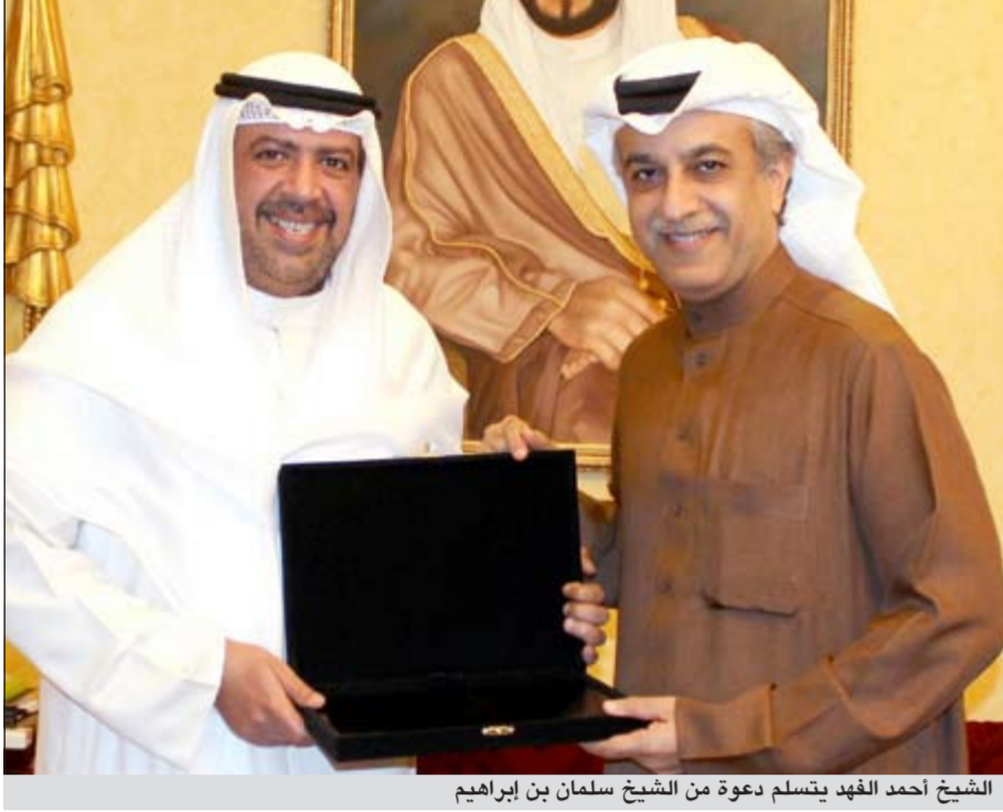
الشيخ أحمد الفهد يتسلم دعوة من الشيخ سلمان بن إبراهيم

وأكد ثقته بنجاح البحرين في تنظيم الدورة في ظل الرعاية الكريمة التي يوليها الملك حمد بن عيسى آل خليفة وسمو ولي عهده والحكومة البحرينية لقطاعي الشباب والرياضة في المملكة، علاوة على الإمكانيات الإدارية والفنية التي يمتلكها الشباب البحريني في التنظيم وحسن الضيافة التي يتميز بها الشعب البحريني. يذكر أن المنتخبات المشاركة قسمت الى مجموعتين ضمت الثانية المنتخب الوطني حامل اللقب الى جانب السعودية والعراق واليمن بينما تضم الاولى منتخبات الامارات والبحرين وعمان وقطر.