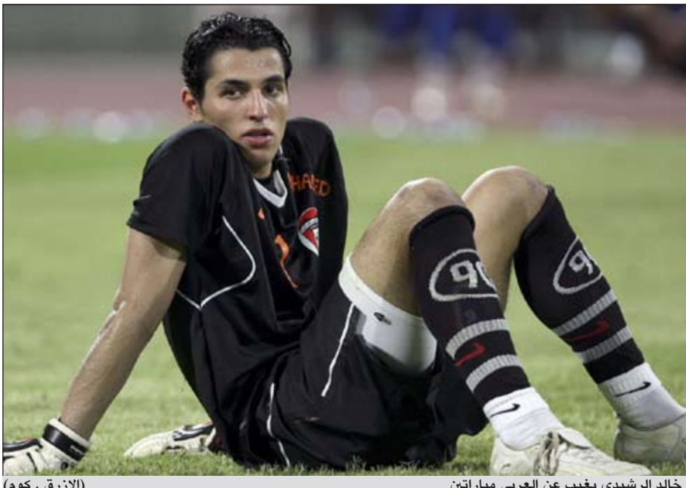
(الأزرق - كوم)