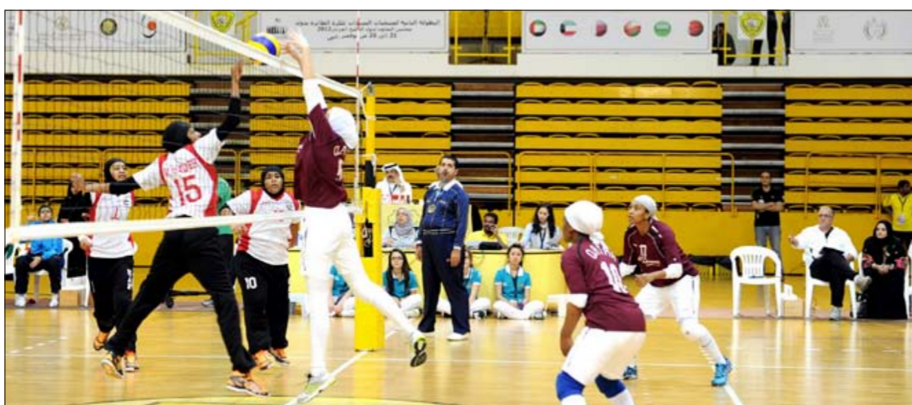
تجربة مهمة لمنتخب طائفة السيدات أمام عمان