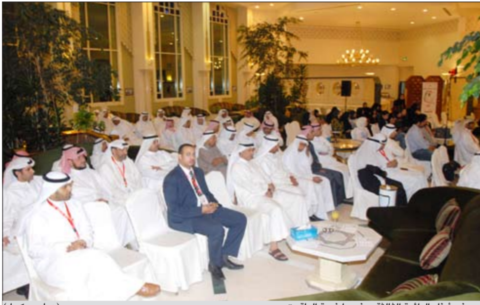
بعض أبناء الدائرة الثالثة حضروا ندوة الياقوت (عباس محفل)

وختتم د.الياقوت كلمته بقوله: نحن كما تعلمون ننتهج الفكر الوسطي الفكر الثالث غير المائل لأحد لا للموالاة ولا للتأزيم هدفنا الكويت والكويت فقط... عاشت الكويت أبية مرفوعة الرأس.