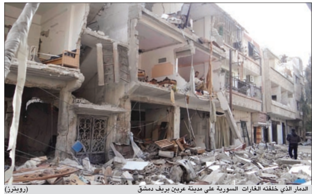
الدمار الذي خلفته الغارات السورية على مدينة عربين بريف دمشق

من جهة ثانية، افاد المرصد عن مقتل ثلاثة أشخاص على الأقل في «انفجار عبوة ناسفة» استهدفت كبة للقوات النظامية على طريق ادلب المسطومة».