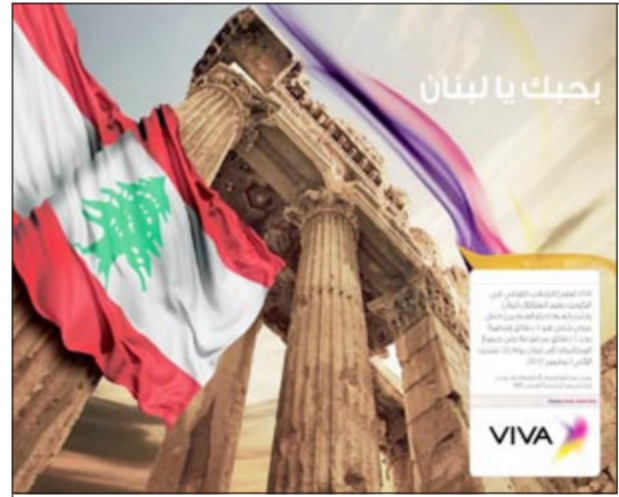
بصك يا لبنان