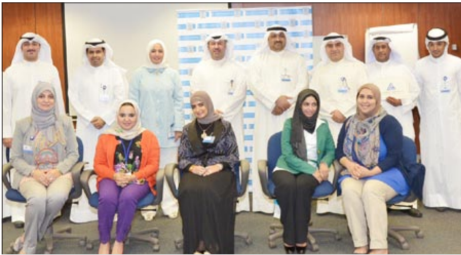
لقطة جماعية للمكرمين

في بنك الكويت الدولي تخريج الدفعة الرابعة من موظفي الإدارة المصرفية للأفراد الجدد بعد اجتيازهم بنجاح هذا البرنامج التدريبي الذي تم أعداده من قبل قسم التدريب في البنك بالتنسيق مع الإدارة المصرفية للأفراد وإدارات البنك الأخرى، كما أشارت إلى أن هذه الدورات تعمل على تعريف الموظف بأسس العمل المصرفي الإسلامي الإقرارافي، وذلك عن طريق التدريب العملي والظري، والإحتكاك الفعلي بالعمل، والتعرف على إدارات البنك وطبيعة عمل كل إدارة، بالإضافة إلى التعرف على سياسات وإجراءات الإدارة المصرفية للأفراد».