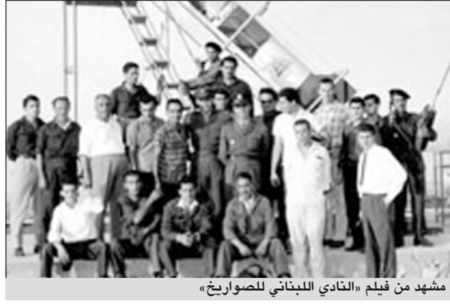
مشهد من فيلم «النادي اللبناني للصواريخ»