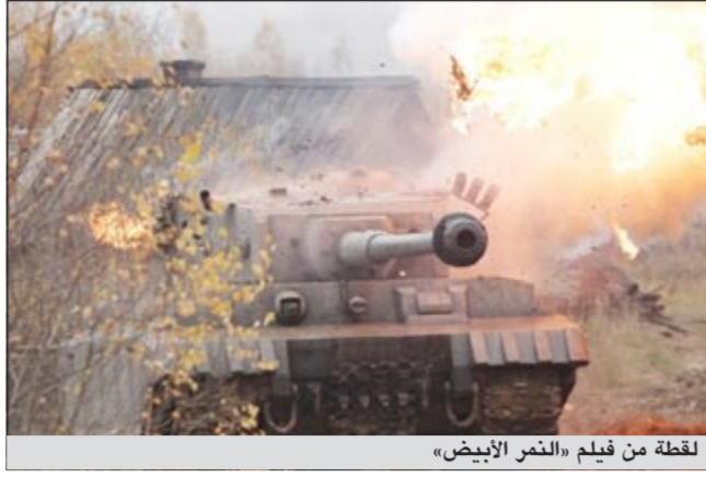
لقطة من فيلم «النمر الأبيض»