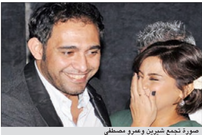
صورة تجمع شيرين وعمرو مصطفى

على أداء أحد المتسابقين لأغنية «لمسك». وردا على كلام شيرين، قال مصطفى: «لن أعلق فيكفيها الردود التي انهالت عليها عن «فيسبوك» و«تويتر» سواء من جمهوري أو من قبل المشاهدين العاديين.