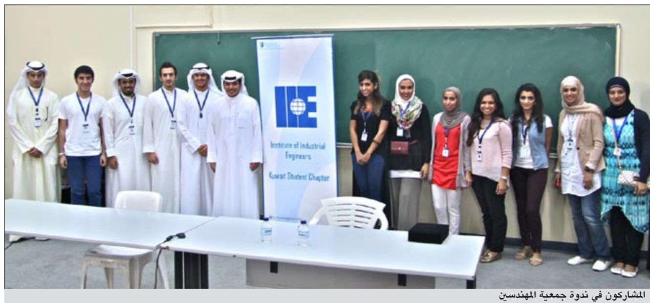
المشاركون في ندوة جمعية المهندسين

خلال ندوة جمعية المهندسين في كلية الهندسة