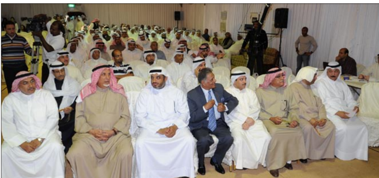
جانب من الحضور في مقر مشام الشايح

المعارضين حينما تحدث له عن جدوى المعارضة بعد تشكيل المجلس فجاءت اجابته أنه في هذه الحالة سيكون هناك عصيان مدني ما يعني شل البلد تماما. وأوضح أن هناك من يحرك الشباب ويحرضهم على اضاءة مستقبلهم وهو يجلس في الخلف يشاهد ما يحدث، مضيفا أنه حتى في حالة العصيان المدني لنحو 50٪ من الموظفين فإن المصالح لن تتعطل لأن كل موظف له عدد من الاحتياط بسبب التخمته الوظيفية وكذلك في ظل وجود 30 ألفا ينتظرون فرصة التعيين في القطاع الحكومي ومقيدين في ديوان الخدمة المدنية. وكشف عن كون مجلس 2009 أراح الستار عن تلك المجموعة التي ترى مصلحتها فقط وليس شيئا آخر متسانلا، لماذا لا نجرب الصوت الواحد؟ فإذا كانت المشاركة أكبر مما نتوقع كانت علامة على الاستمرار، لافتا إلى أن الأزمة الراهنة أثرت على جميع القضايا وفي مقدمتها قضية الإسكان والجميع يعرف أن بعض أبناء الكويت لهم 18 عاما وهم ينتظرون دورهم في السكن وهو أمر كان يحتم البحث عن حل لتلك المشكلة بدلا من الخلاف بين السلطتين التشريعية والتنفيذية. وأوضح ان الأزمة الإسكانية تقتضي أن يكون سكن الكويتي أولوية وان يتم نقل بعض المنشآت العسكرية والمزارع والجواخير الى المناطق البعيدة وكذلك إخلاء