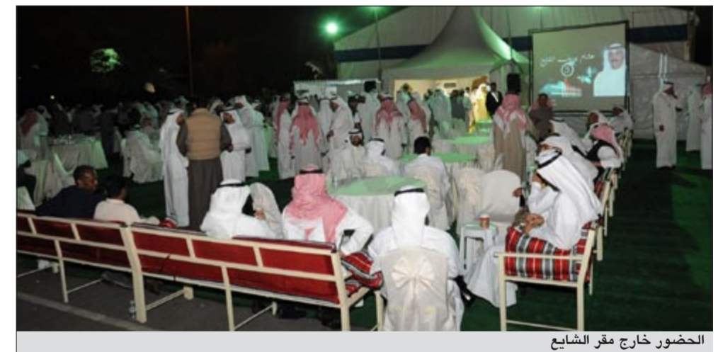
الحضور خارج مقر الشايح