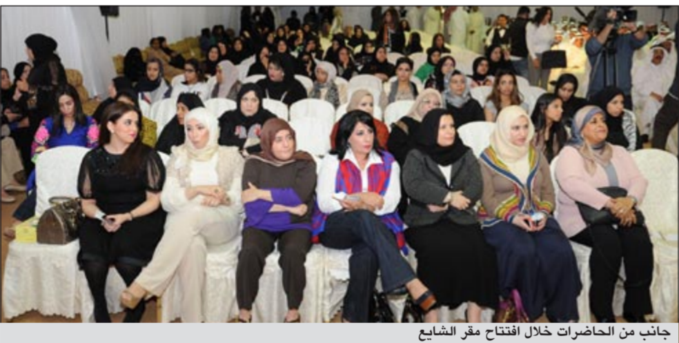
جانب من الحاضرات خلال افتتاح مقر الشايح

وأنشأ الشايح الى ان الجميع يتفق على ان المجلس السابقة لم تحقق الطموح وأن المشاريع جميعها متوقفة وقد شاهدنا الشباب يخرجون للشارع في صرخة ناجمة عن اخفاق المجلس في تحقيق طموحهم وقتها وجدنا الأقلية في مجلس 2009 تخرج للشارع وشاهدنا وقتها من يشكك في القضاء. وقال الشايح في 2012 رشحت نفسي وكانت هناك منافسة شريفة ووصل نواب أفاضل لكن المشكلة فيما بعد تشكيل مجلس 2012 إذ تحولت المعارضة الى أغلبية وكان يفترض ألا تكون هناك مشكلة إلا